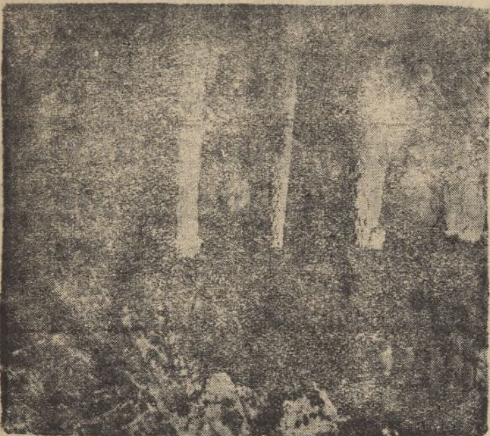
Lago de la Tragedia en la Gruta de las Maravillas, de Aracena.

de Perrault. Julianita, la linda molinera, ama lo imposible. Para ella no existe el querer de los mozos del pueblo que la persiguen requiriéndola con tales amores. Un día su madre le dijo: