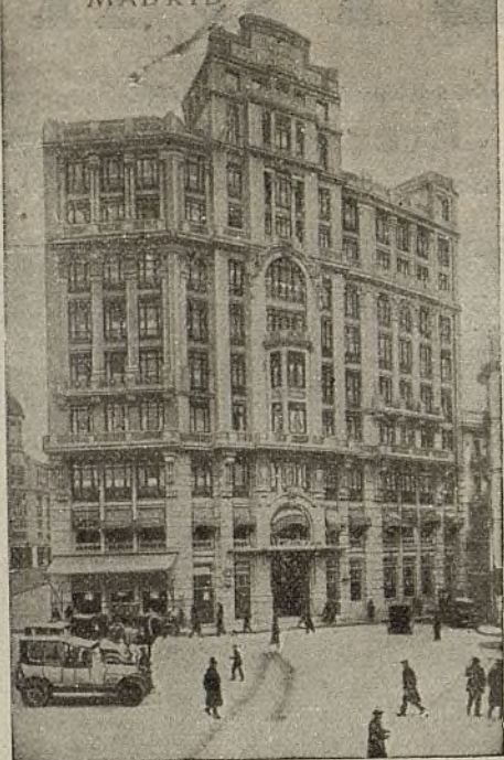
HOTEL FLORIDA MADRID