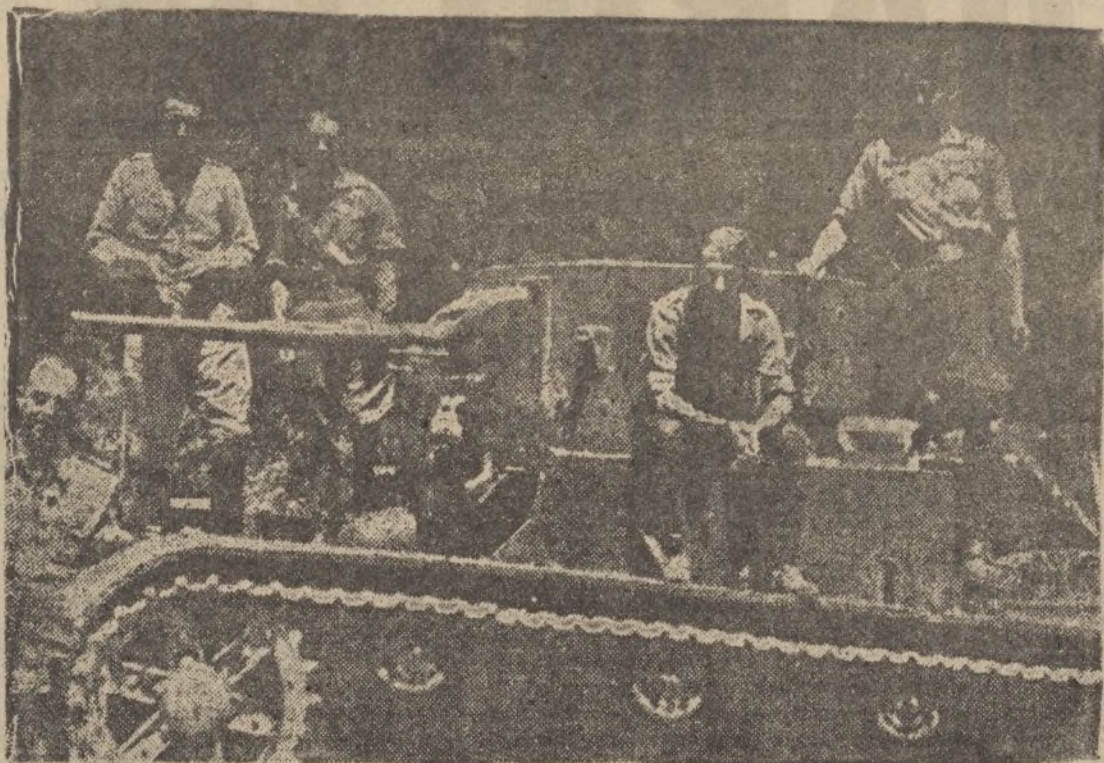
Legionarios y oficiales sobre un magnifico t. que ruso cogido con otros mas, por nuestros soldados en una posición cerca de Brunete