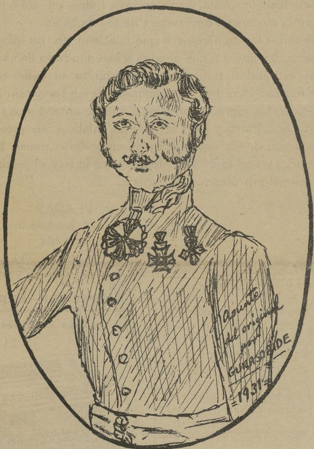
LOS HIDALGOS DE LA RAZA