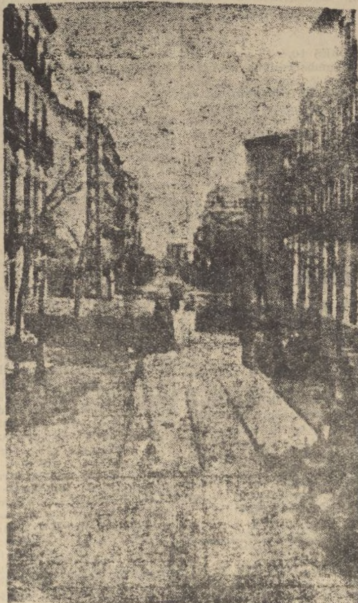
Una calle de Madrid con trincheras y parapetos levantados por los rojos.