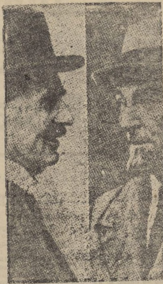
M. Grandi y M. Neville Chamberlain