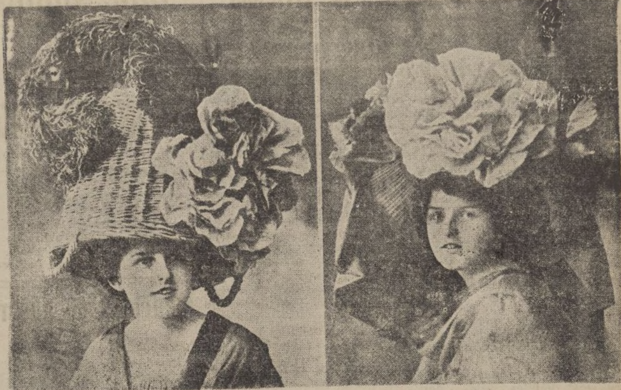
Mayo de 1909.—Una bella muchacha tocada a la última moda de entoces