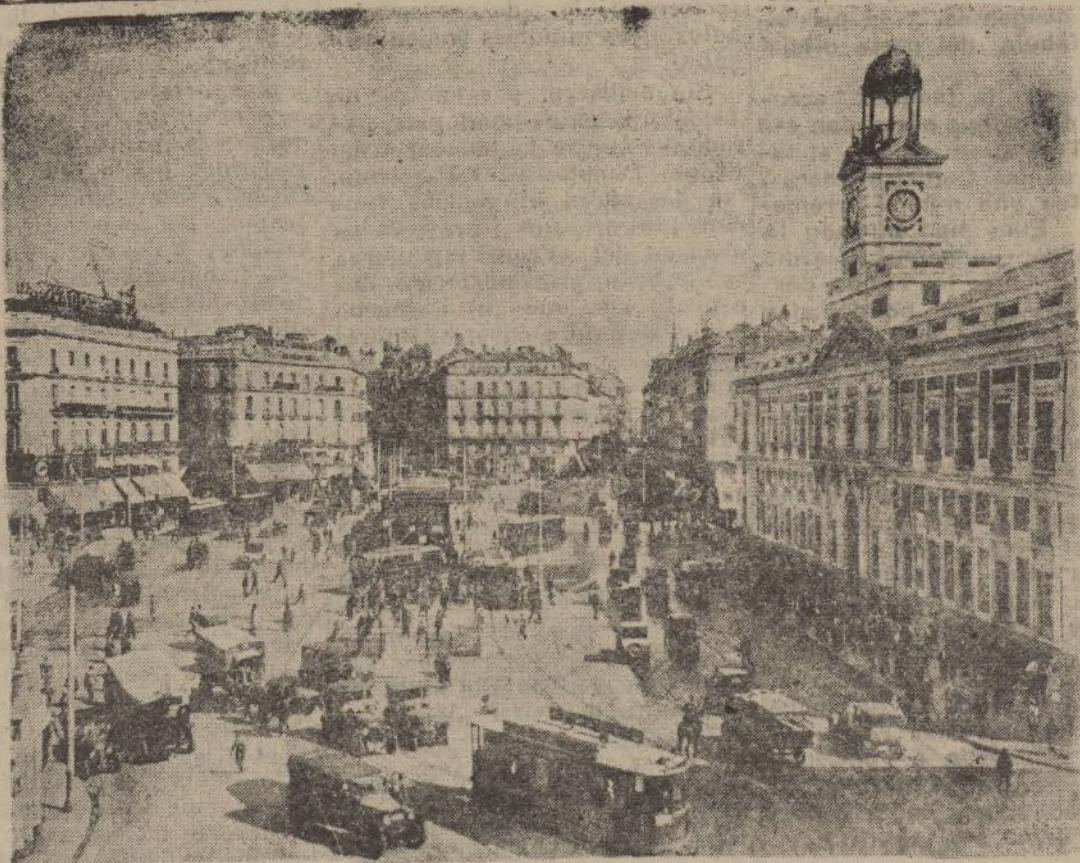
LA PUERTA DEL SOL

Era verdad que a la sombra del «casticismo» se había edificado una mediana literatura y una mediana música de «género chico». Era verdad que se habían arrancado de Madrid todos los personajes episódicos de unos sainetes de endeble textura dramática. Era cierto que los vividores de la exaltación del tópico habían logrado una atmósfera propicia a sus poruetas de ingenio. Pero, sin embargo, la solera madrileña permanecía perfumando el «pañuelo» del mundo de esencias raciales.