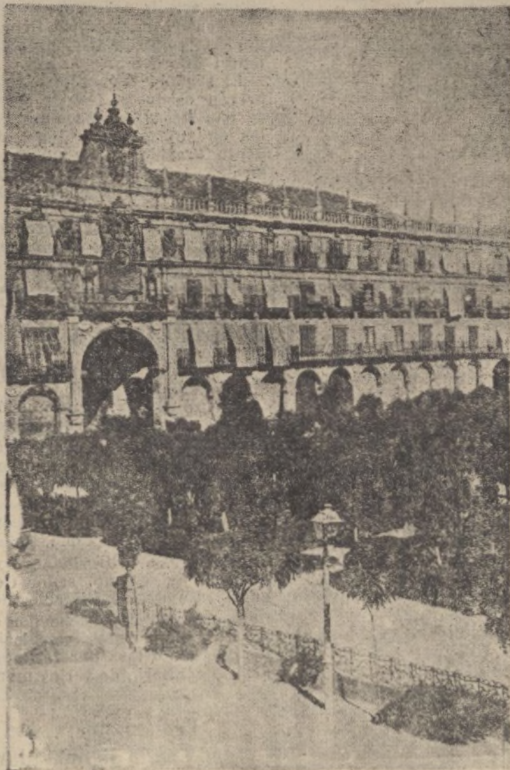
Vista parcial de la Plaza Mayor de Salamanca