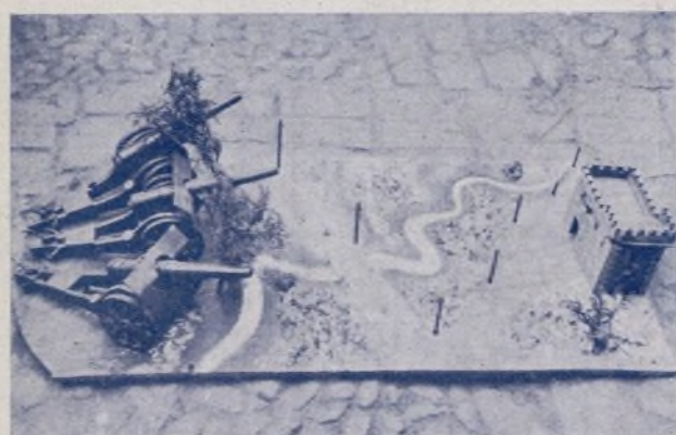
"Baterías", trabajo presentado por los talleres de la Brigada