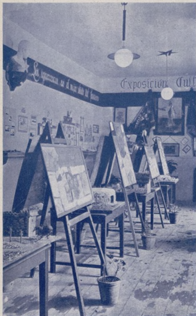
Vista parcial de la Exposición