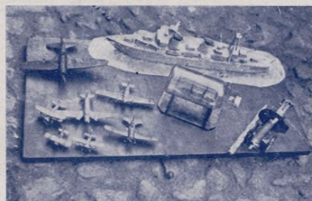
Trabajos manuales que fueron premiados y que gustaron mucho