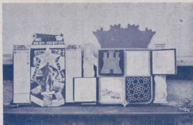
"Unión", primer premio de periódicos murales, e "Intendencia", uno de los más destacados