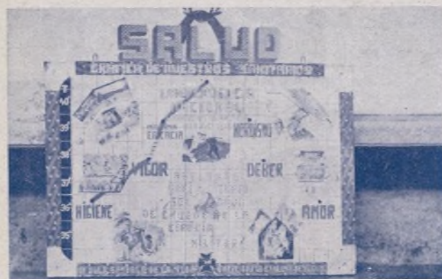
"Salud", mural de Sanidad, también premiado