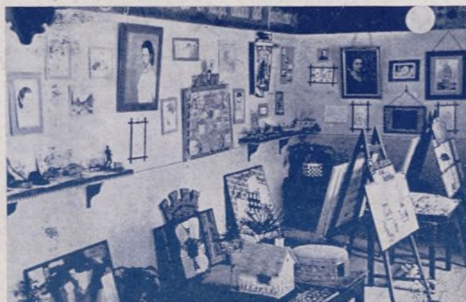
Otra vista parcial de la Exposición