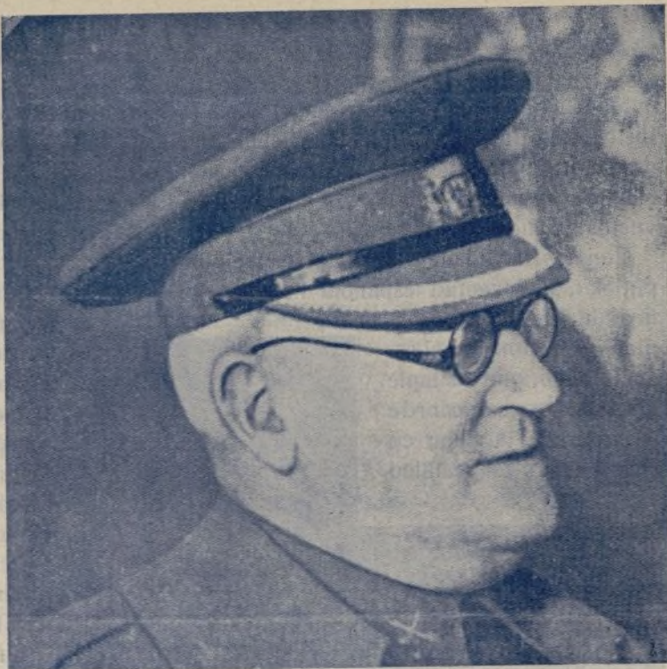
El insigne General Miaja, que en el mes de noviembre supo dirigir las operaciones para la defensa de nuestro Madrid.

El 7 de noviembre es el día del nacimiento de una juventud nueva; juventud heroica que había permanecido al margen de la lucha directa. Millares de jóvenes despertaron en aquella fecha gloriosa y no pensaron si eran los re-