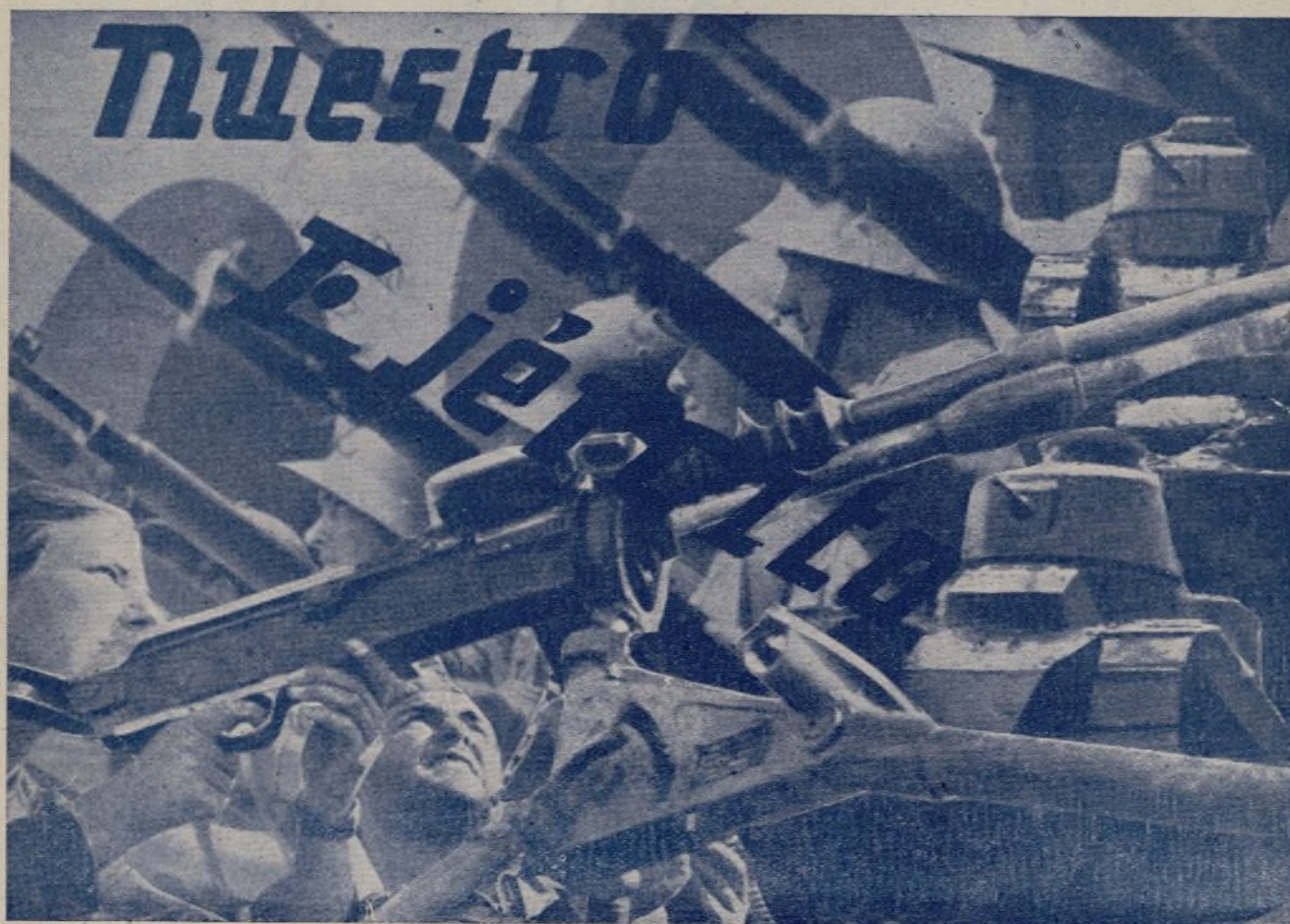
Forjada en la lucha constante, la juventud española organiza su Ejército con aspiración a igualar al ejército soviético.

¡Pueblo ruso! El pueblo español está dispuesto a imitaros, y por eso os decimos, en vuestro XX aniversario, que sabremos morir antes que ceder al fascismo internacional.