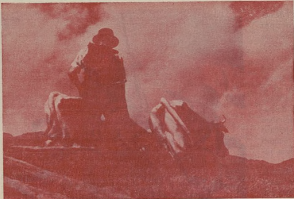
En la Rusia de ayer, como en la España, el arado era la tracción animal con que contaban los campesinos.

agua como en su elemento y cubre los 100 metros a braza en un minuto siete segundos, y Osselino, saltador con pértiga, que se eleva hasta 4,30 metros, como si lo empujase un resorte, y pasa el listón en una perfecta «gamba», maravillosa, por lo bajo que coge la pértiga. Pero el más allá es Popoff, levantador de peso, que batió el «record» mundial, levantando 175 kilos, y que no levantó más porque en el «stadium», con general asombro,