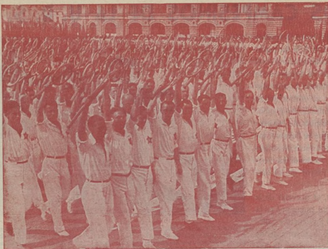
Moscú.—Desfile de los equipos de «tennis».

no había más pesas para poner en sus manos. Hacia eso encaminamos nosotros los pasos. Hacia la consecución de una juventud fuerte que, como la soviética, pueda llevar en su pecho una condecoración de «aptos para el trabajo y la defensa». Nuestros primeros pasos fueron vacilantes; hoy se afianzan más y más. Pronto experimentaremos la alegría de ver consignada, en nuestro presupuesto nacional, una