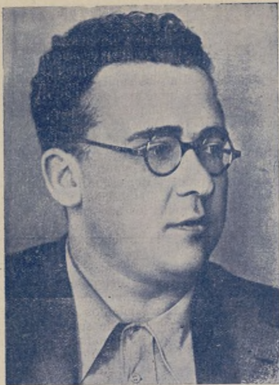
Santiago Carrillo, desde la Delegación de Orden Público, cooperó brillantemente a la defensa de la heroica ciudad.