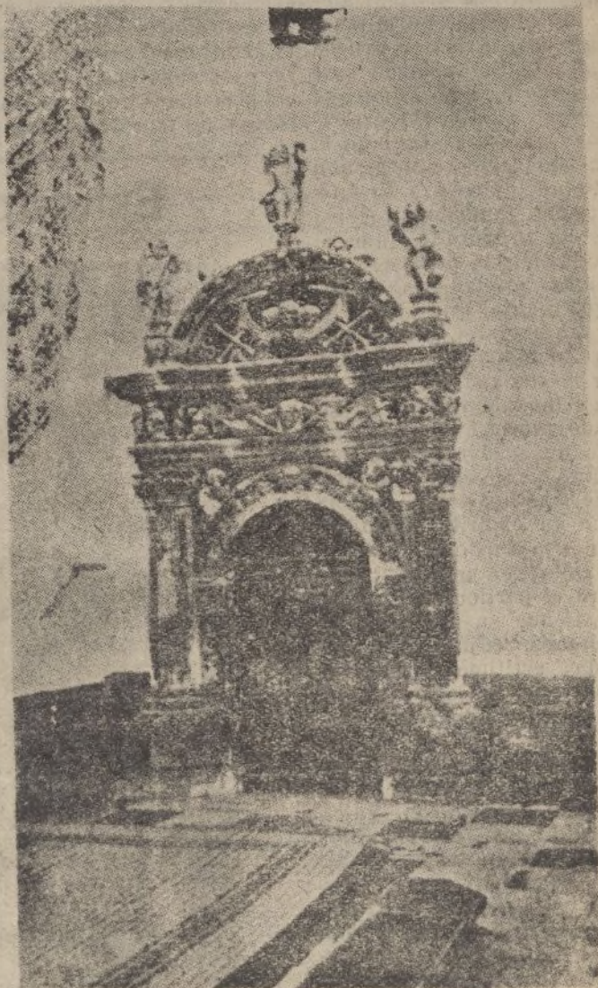
OSUNA.—Entrada al Panteón de los Duques de Osuna