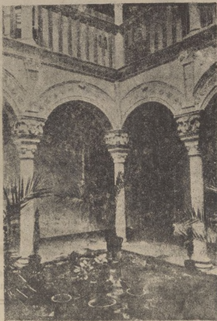
OSUNA.—Patio de la Iglesia del Santo Sepulcro, Siglo XVI

Pues bien, las piezas han sido ya adquiridas y dentro de muy pocos días empezará su envío a España, vía Córcega, siendo la casa Castollé y Garriga la encargada de su tránsito.