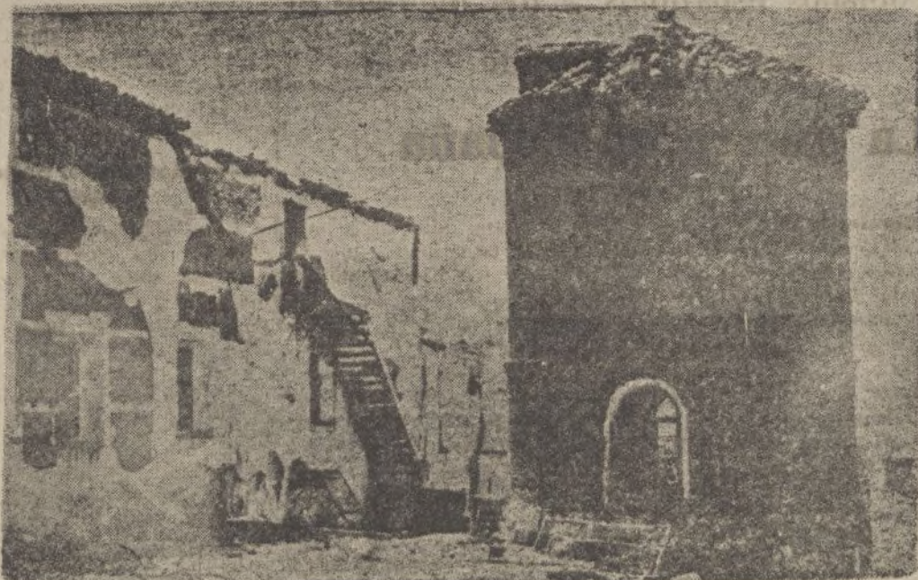
El molino de Brunete, destruido por los rojos.