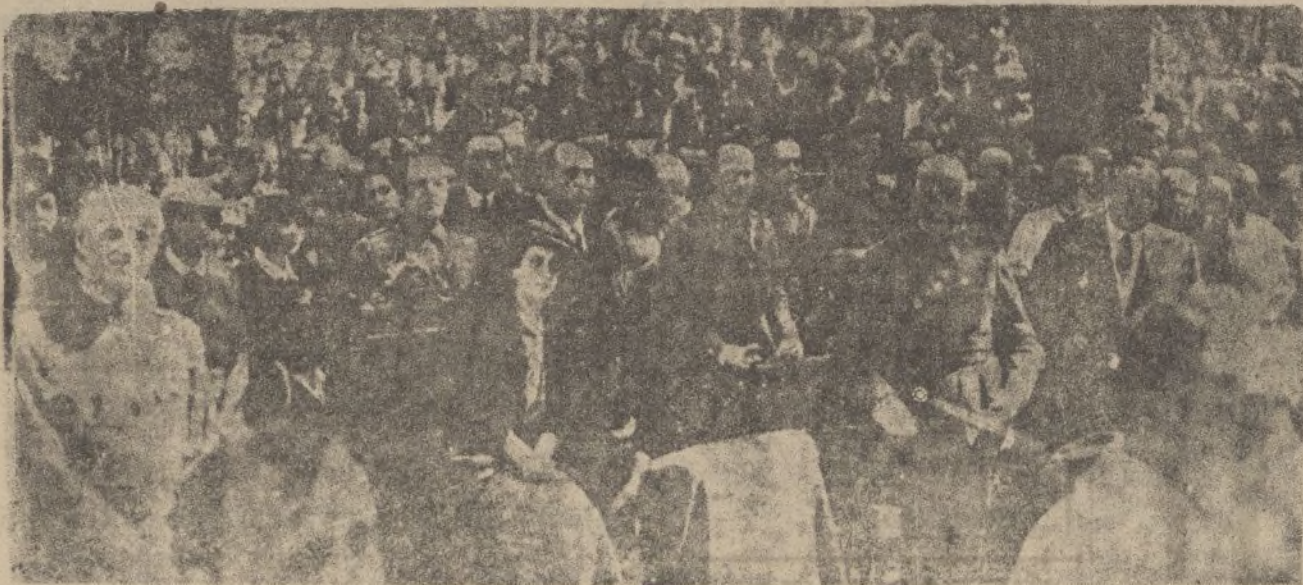
BILBAO.—Doña Carmen Polo de Franco y autoridades, durante el acto solemne de ser devueltas a la imagen de Nuestra Señora de Begoña las joyas que la robaron los rojos-separatistas.