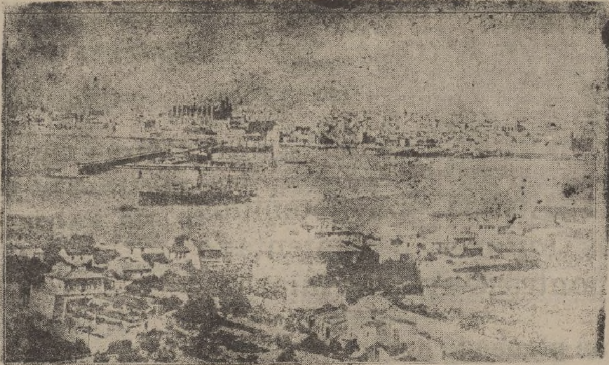
Vista del Puerto de Mallorca