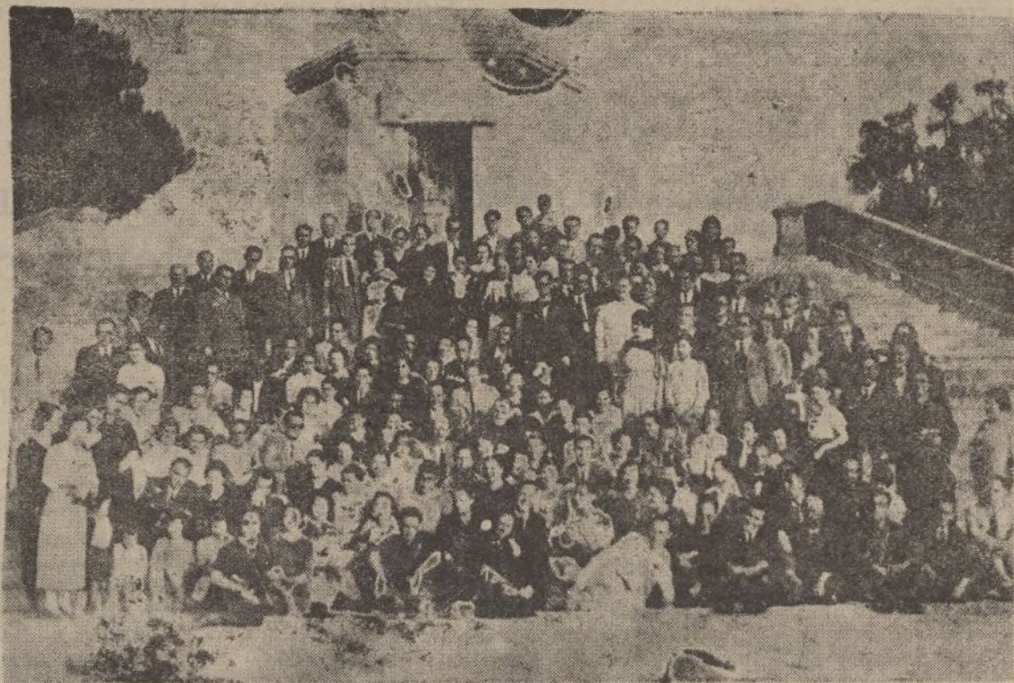
Los maestros cursillistas «posan» al pie del monumento conmemorativo del Descubrimiento en la Rábida

lecciones. La lección del Maestro eterno, la lección de la Humildad y del Amor: la Sagrada Eucaristía.