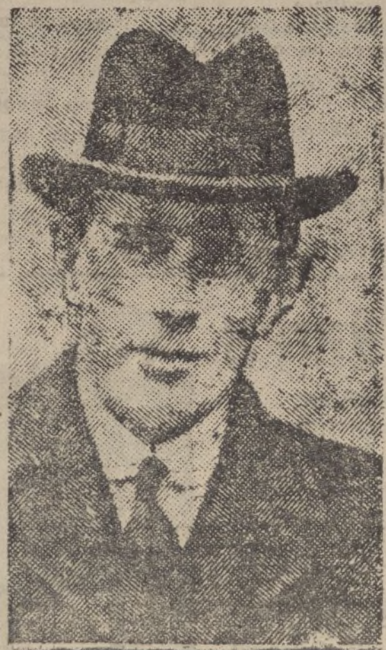
Lord Halifax, a quien se le considera en los círculos diplomáticos europeos como sucesor de Eden en el ministerio de Negocios Exteriores inglés.