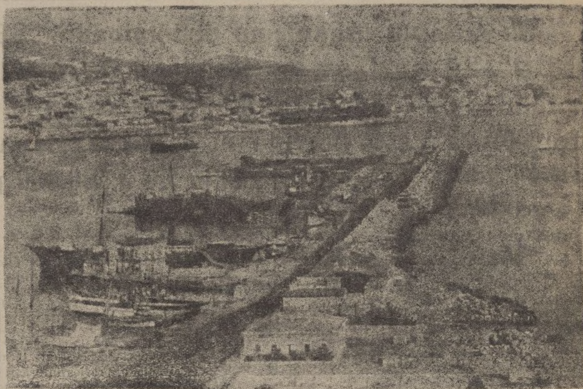
Puerto de Palma y Caserio del Terreno y Porto-Pi

tavoces del Gobierno «legítimo» en los medios internacionales. Continúa diciendo que aunque no figurara en el orden del día, se aprobará una proposición de ley y un voto de confianza a la Delegación Española de Ginebra, con objeto de que haga una denuncia trascendental en aquel organismo internacional.