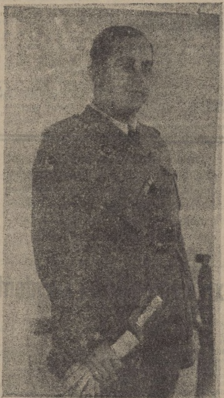
El nuevo general del Ejército español don Francisco García Escámez

fué una amenaza del caudillo marroquí que le salió mal. Este había prometido a Primo de Rivera atacar a Tetuán si nuevas tropas hacían el desembarco de Alhucemas, y al ver que salían tropas españolas de Tetuán, puso inmediatamente cerco a Kudia Tahar que era la llave de defensa de aquella plaza.