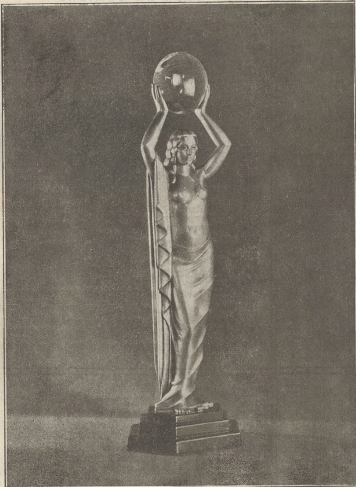
Gran trofeo de plata para la fotografía que alcance el Gran Premio Internacional de 80.000 pesetas

Seis clases: A. Fotografías de niños . B, Paisajes . C, Deportes . D, Asuntos de la Naturaleza, arquitectura, interiores . E, Retratos . F, Animales .