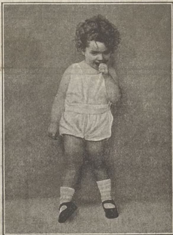
Esta preciosa sencilla fotografía obtuvo el primer premio en el concurso Eastman Kodak de 1929

Sres. Bartolozzi, dibujante; M. Benlliure, escultor; J. Francés, crítico de arte; P. Muñoz Seca, autor dramático; Pérez de Ayala, novelista, F. Ribas, dibujante; J. Turina, compositor