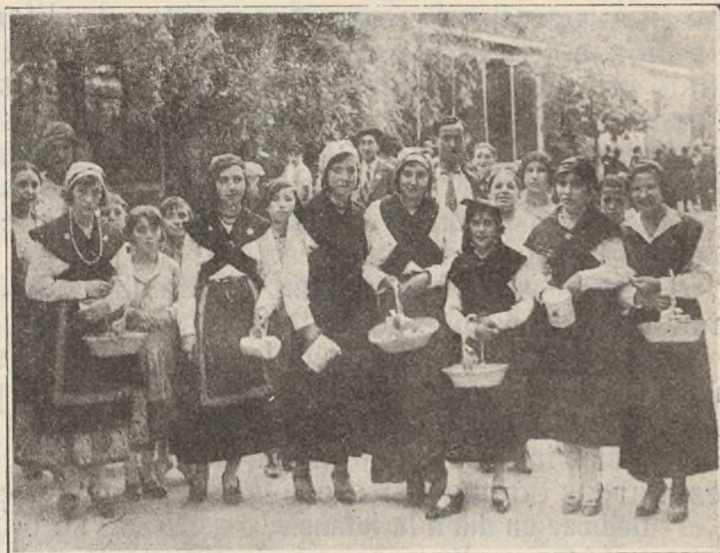
Bellísimas señoritas postulantes, con los típicos trajes regionales.