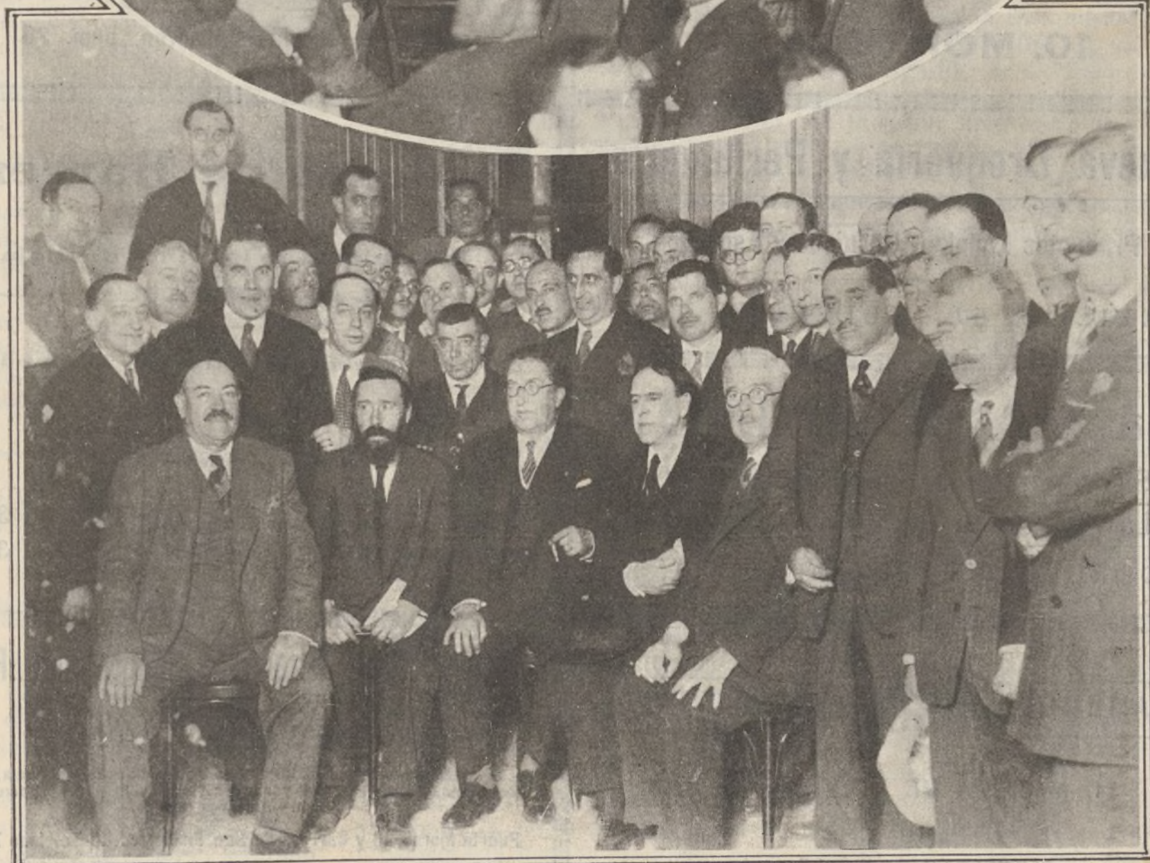
Inauguración de la Casa de la República el día 1.º de junio 1931