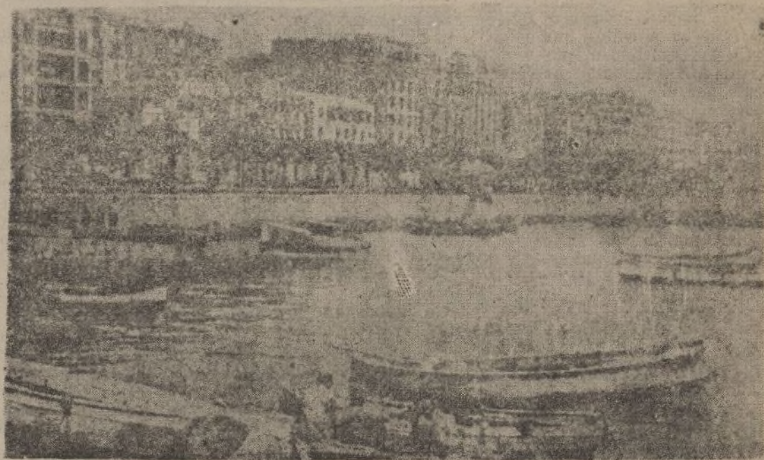
Una vista, cara al puerto, de la hermosa capital montañesa que acaba de reincorporarse a la España nacional y triunfante

jón es ya de anarquía, no entendiéndose los dirigentes de la repetida Junta con los jefes de las milicias, habiéndose suscitado muy serios incidentes.