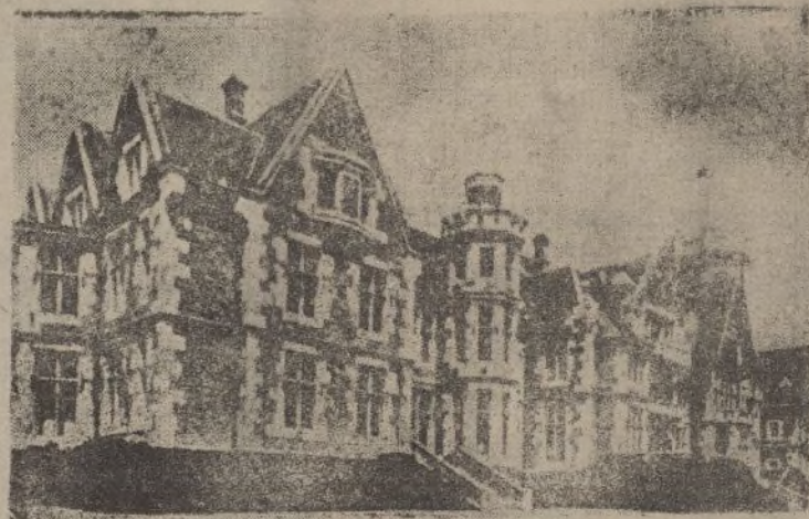
El magnífico palacio de la Magdalena ex-residencia real

el número de prisioneros hasta ahora es de unos 65.000. Entre los que se han rendido hoy, figuran dos batallones formados por asturianos que habían venido a ayudar a sus vecinos los santanderinos. El resto de los