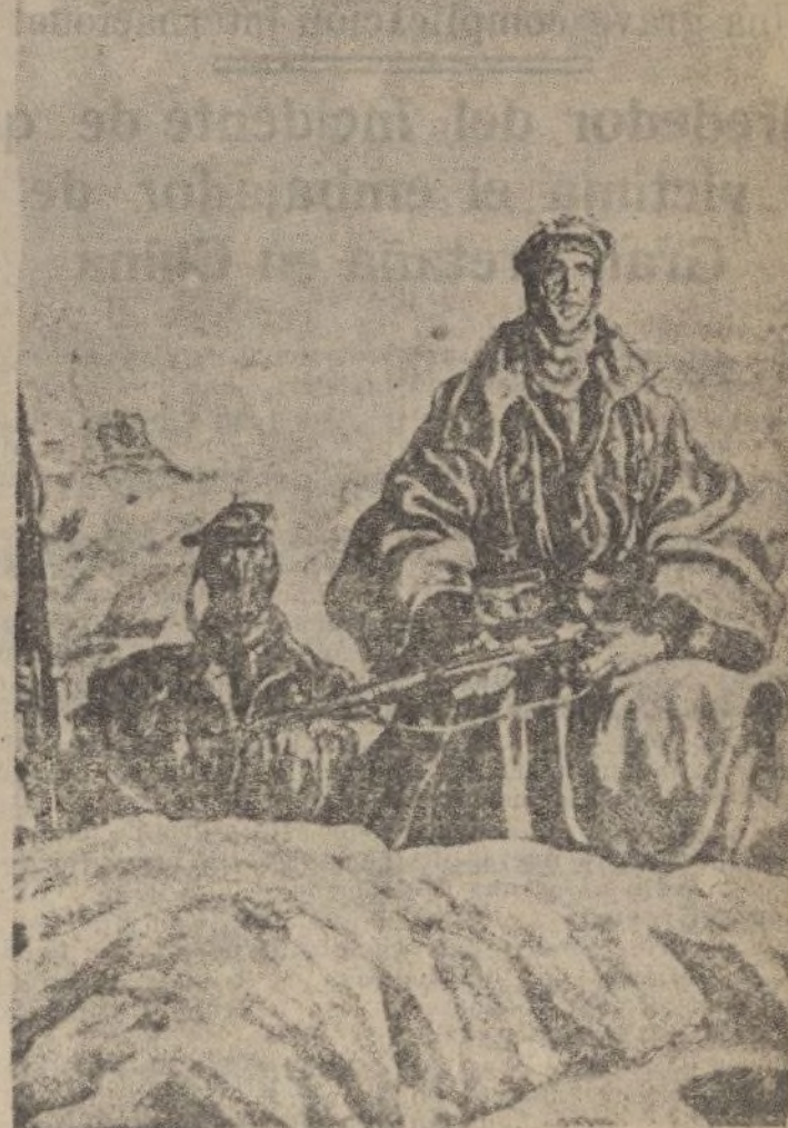
Dos valientes del Requeté en el frente de Madrid