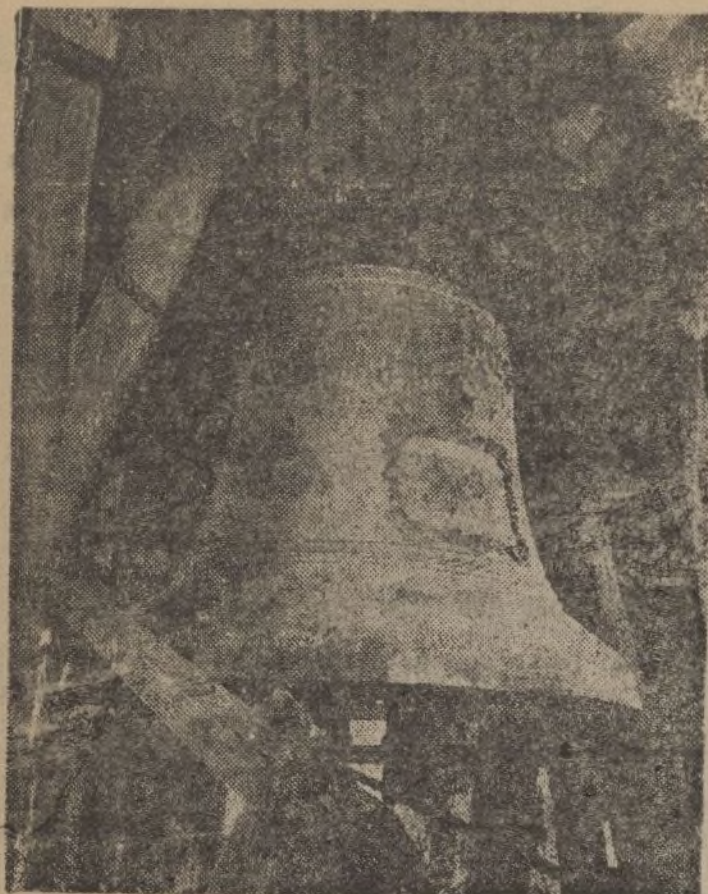
La «Campana gorda», de la iglesia toledana, que en los albores de nuestra Cruzada dió la señal del levantamiento en Toledo y lanzó a todos los vientos el heroísmo de los defensores del Alcázar.

La voz del Caudillo es la voz de España. El «Día sin postre» es una consigna que a la conciencia nacional dicta el Generalísimo. Escucha, español, la voz de la Patria y cumple ese día con tu deber.