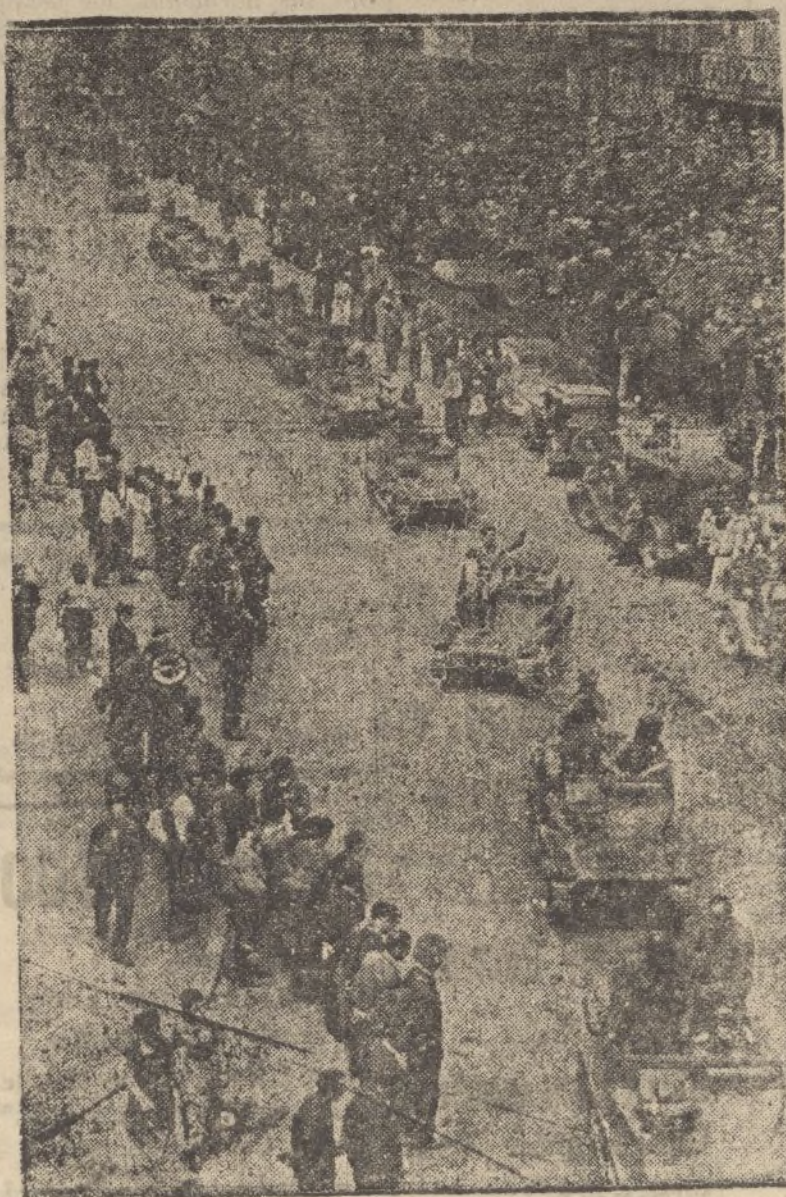
SANTANDER.—Nuestros carros de combate entran triunfalmente en la capital de la Montaña