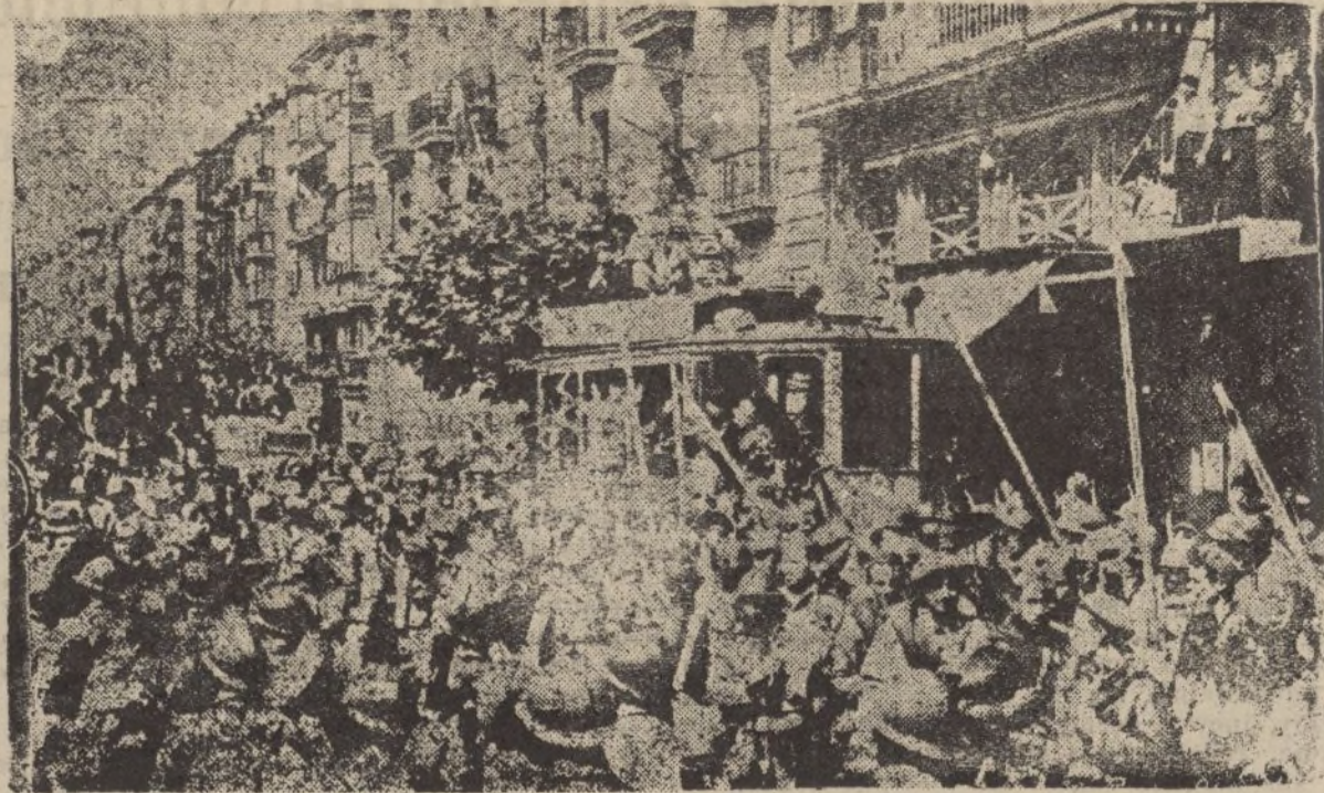
SANTANDER.—El pueblo entusiasmado, aclama a nuestras gloriosas tropas en el paseo de Pereda.