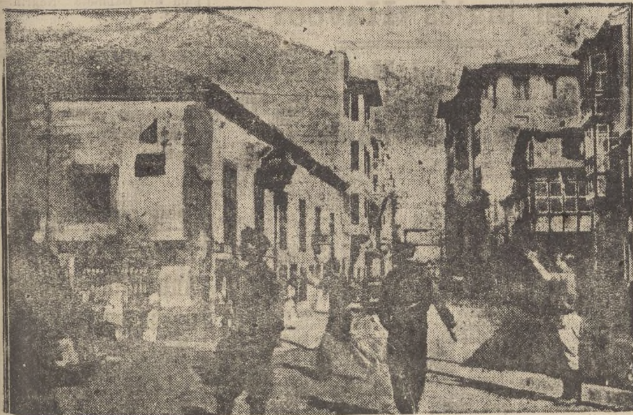
En una calle de Reinosa los soldados nacionales ordenan parar a un coche sospechoso

NUESTROS TELEFONOS: Talleres. 1324 Administración. 1370 Papelería. 1477