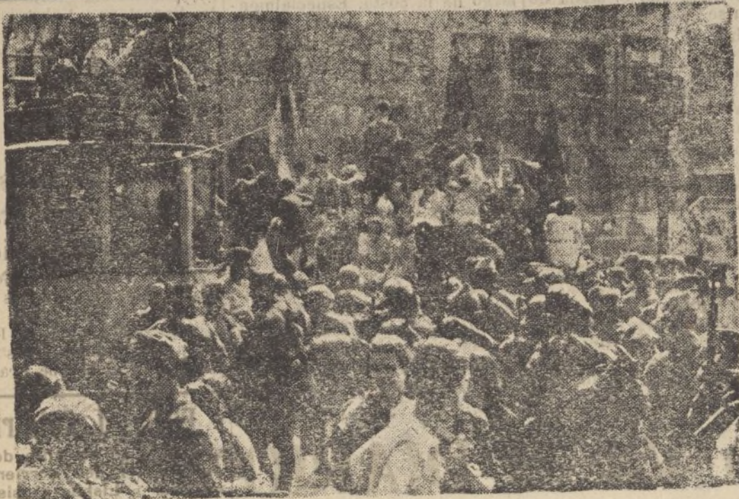
SANTANDER.—Entusiasmo popular al entrar nuestras tropas