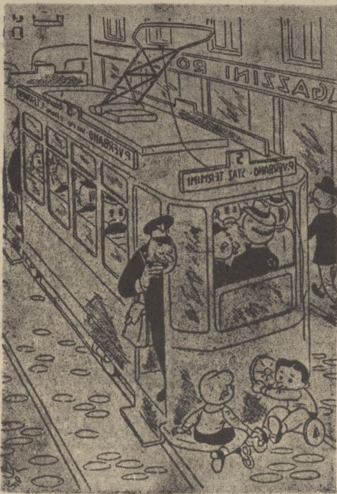
El conductor.—Quiero ver como se las arreglan para descender por la plataforma delantera.