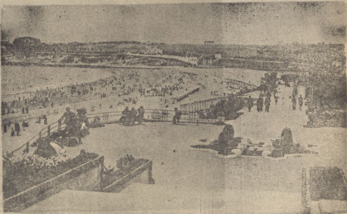
SANTANDER.—Vista parcial de las playas del Sardinero