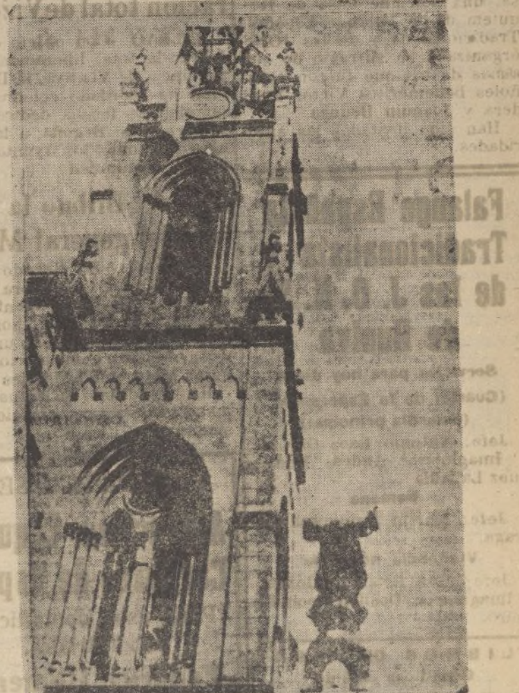
SANTANDER.—El Sagrado Corazón de Jesús decapitado por las hordas rojas.

X LEA VD. X TODAS LAS MAÑANAS X DIARIO DE HUELVA