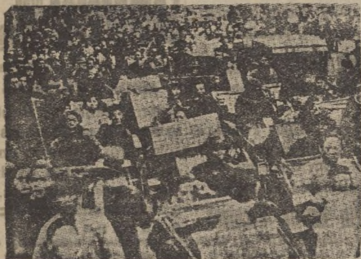
El elemento civil de Shanghai evacua atropelladamente la ciudad

Durante estos días ha habido luchas en los alrededores de Granada; el enemigo, con esa imaginación que le caracteriza, se había propuesto, nada menos que la reconquista de Granada. En los partes cogidos al enemigo en estos días y de algunos de los cuales he dado lectura ante este micrófono, así lo demuestran. Pero ya se ha visto cuál ha sido el resultado de ese despropósito, en que el enemigo ha sufrido, a más del castigo consiguiente a su osadía, una cantidad de bajas verdaderamente considerable.