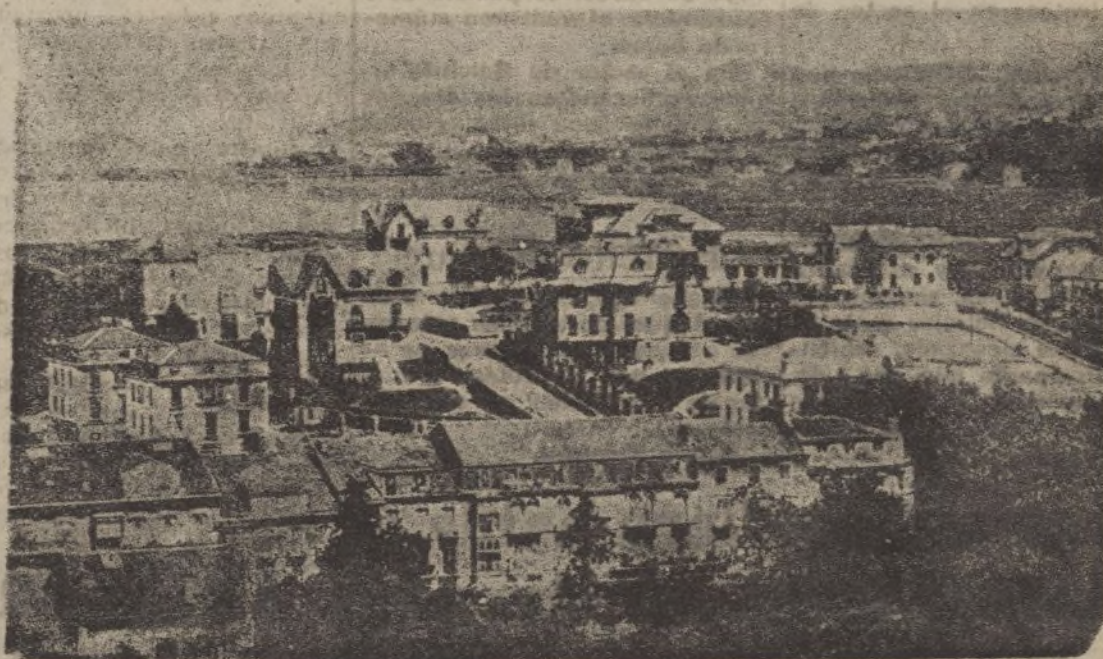
IRÚN.—Barrio de Mendivil Fuenterrabía