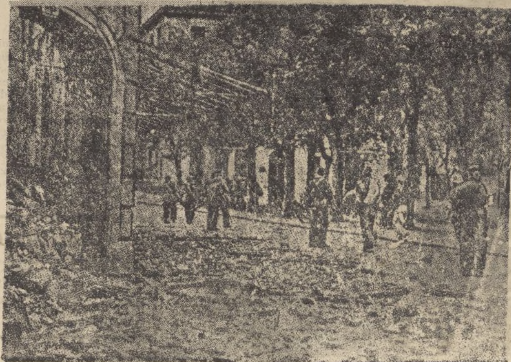
Un aspecto tristemente desolador de Irún a la llegada de las fuerzas salvadoras de España.

Antes de que Azaña se instalase en la finca aludida, se hicieron en la misma obras de decoración y embellecimiento que importaron la friolera de 500.000 pesetas.