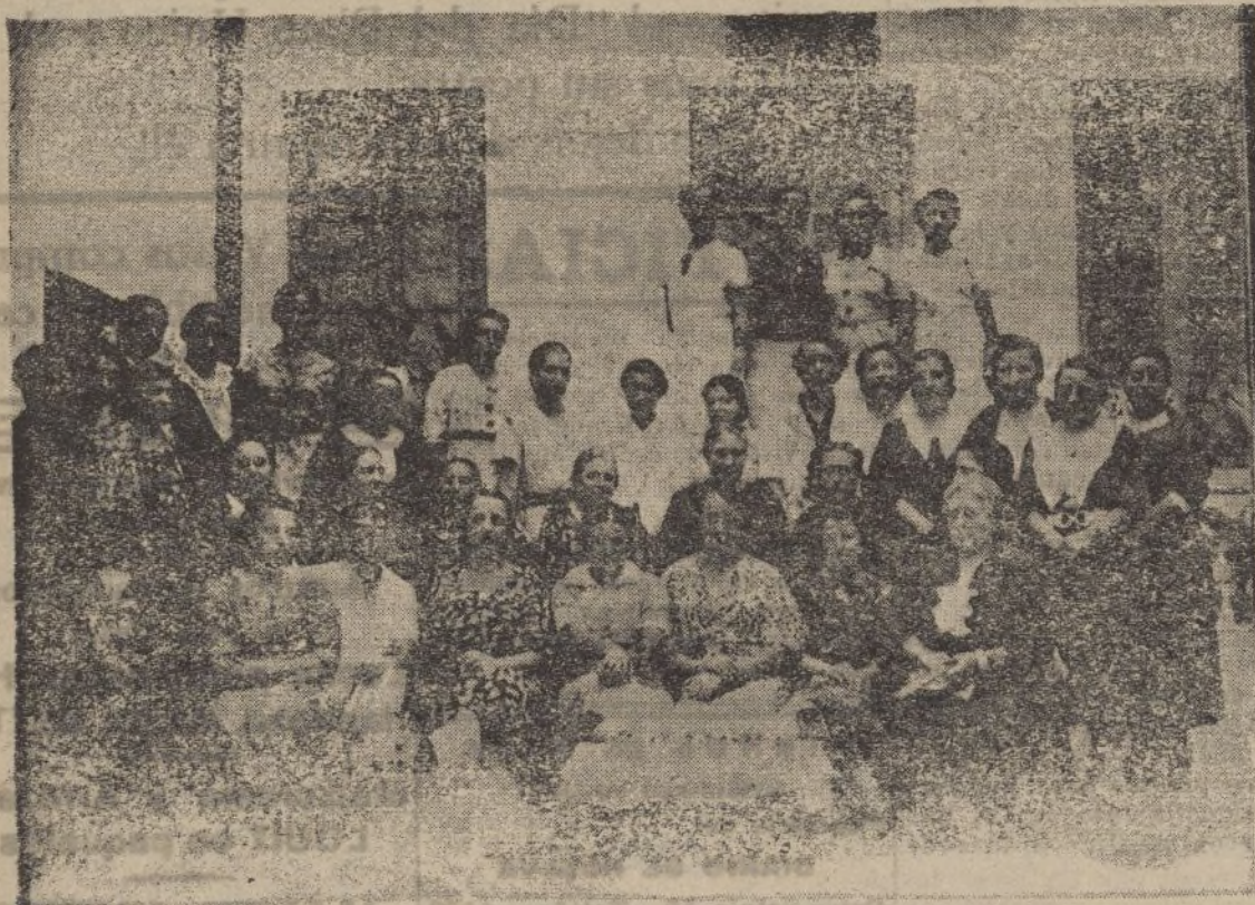
Grupo de señoras y señoritas que están contribuyendo, generosa y gentilmente, al homenaje a los heridos y enfermos de la guerra que se celebrará esta tarde en la Plaza de la Merced

go número uno» digamos también en consagrada frase—que pretendía socavar y destruir los cimientos seculares de la civilización oristiana de Occidente.