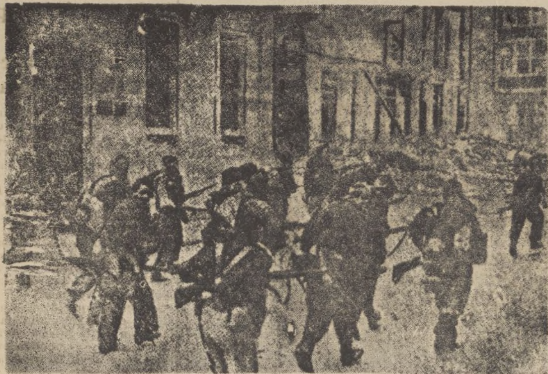
Las tropas nacionales entran victoriosas en Irún, huyendo los rojos después de arrasar la población.

Comandante Haro, 32 — HUELVA — Teléfono, 1853