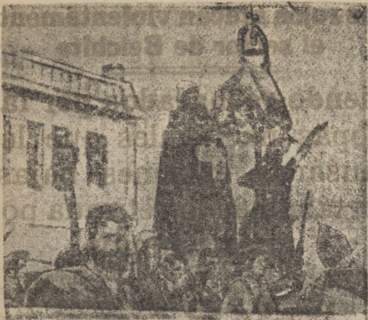
Al entrar las tropas nacionales en Irún, colocan la bandera española en uno de los postes de la luz eléctrica.

ra y cuarenta y cinco minutos, y el 28 de Mayo del mismo año comenzaron a circular los trenes en el trozo Santesteban-Eli zondo, de 12 kilómetros. Este ferrocarril tiene también su estación en el paseo de Colón, cerca de la frontera, y también del de la línea del Norte. Era el ferrocarril minero de la Compañía Irún-Lesaca, que se habilitó para viajeros, dándole doble destino.