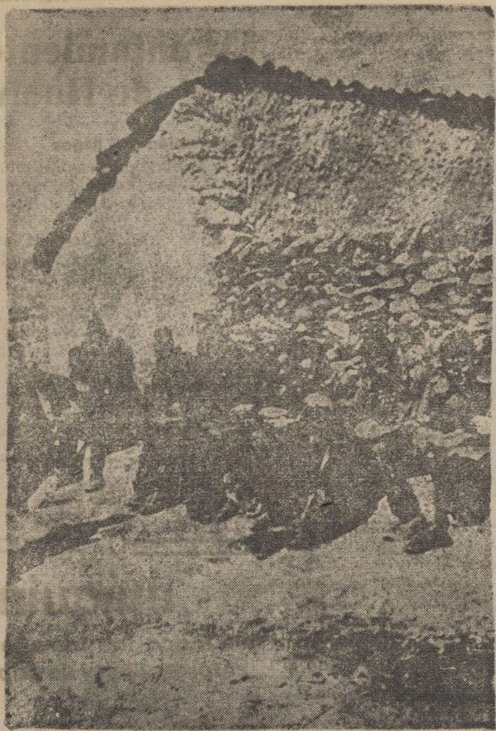
BRUNETE (Frente de Madrid).—Soldados nacionales tomando el rancho despues de un duro combate.