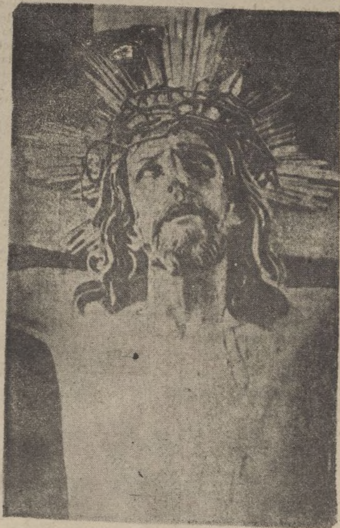
El Santísimo Cristo de Limpieza, magnífica escultura que en un principio se creyó vendida al Extranjero, y que, afortunadamente, pertenece a la España liberada para su culto y devoción grandísimos

Dedica el general otros comentarios a las noticias marxistas, y dice que una vez más se ha demostrado cómo son los judíos los que mantienen la guerra en España, con la ayuda que prestan a los rojos. Extensamente señala el guan