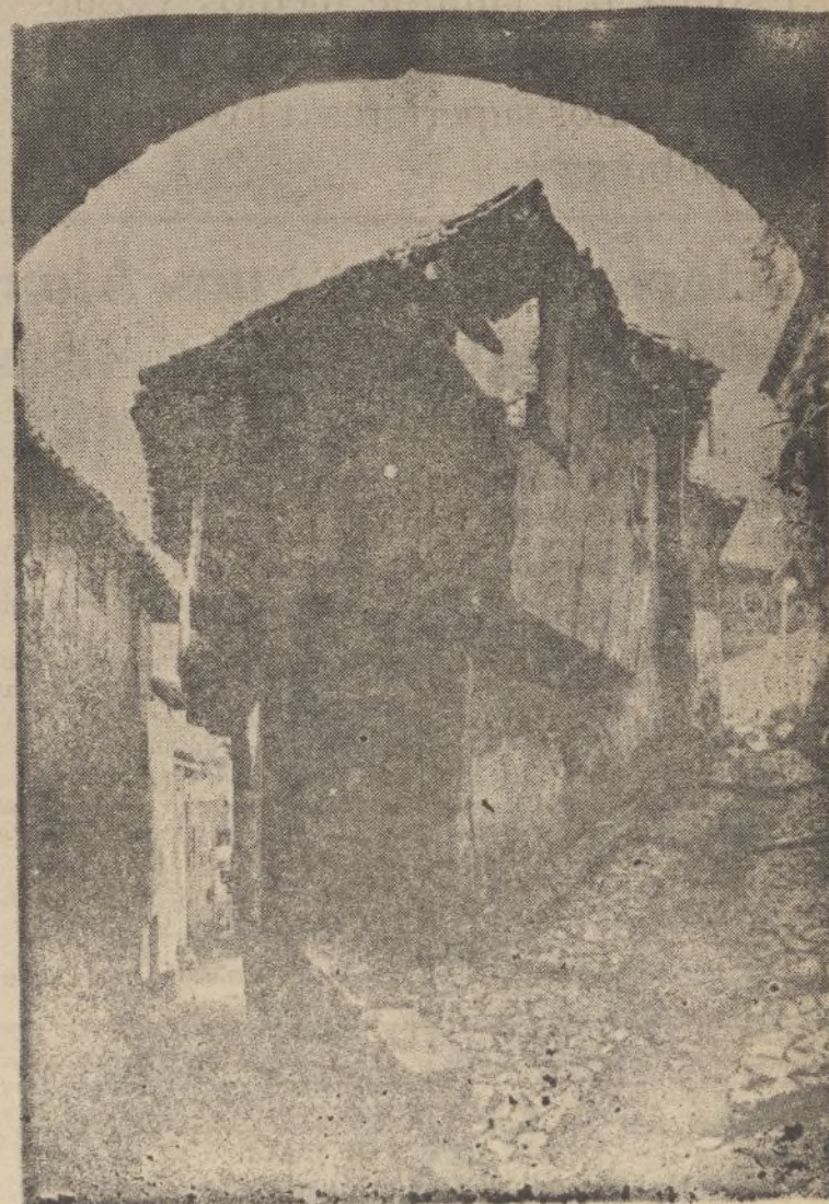
Un rincón típico de Albarracín