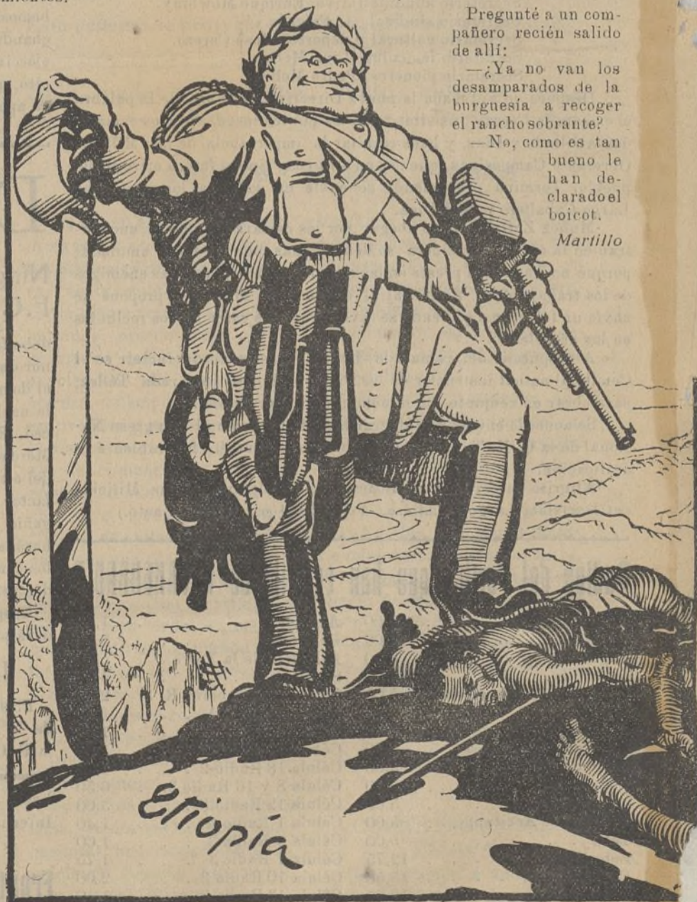
Luchemos contra la guerra imperialista y el fascismo que la engendra.