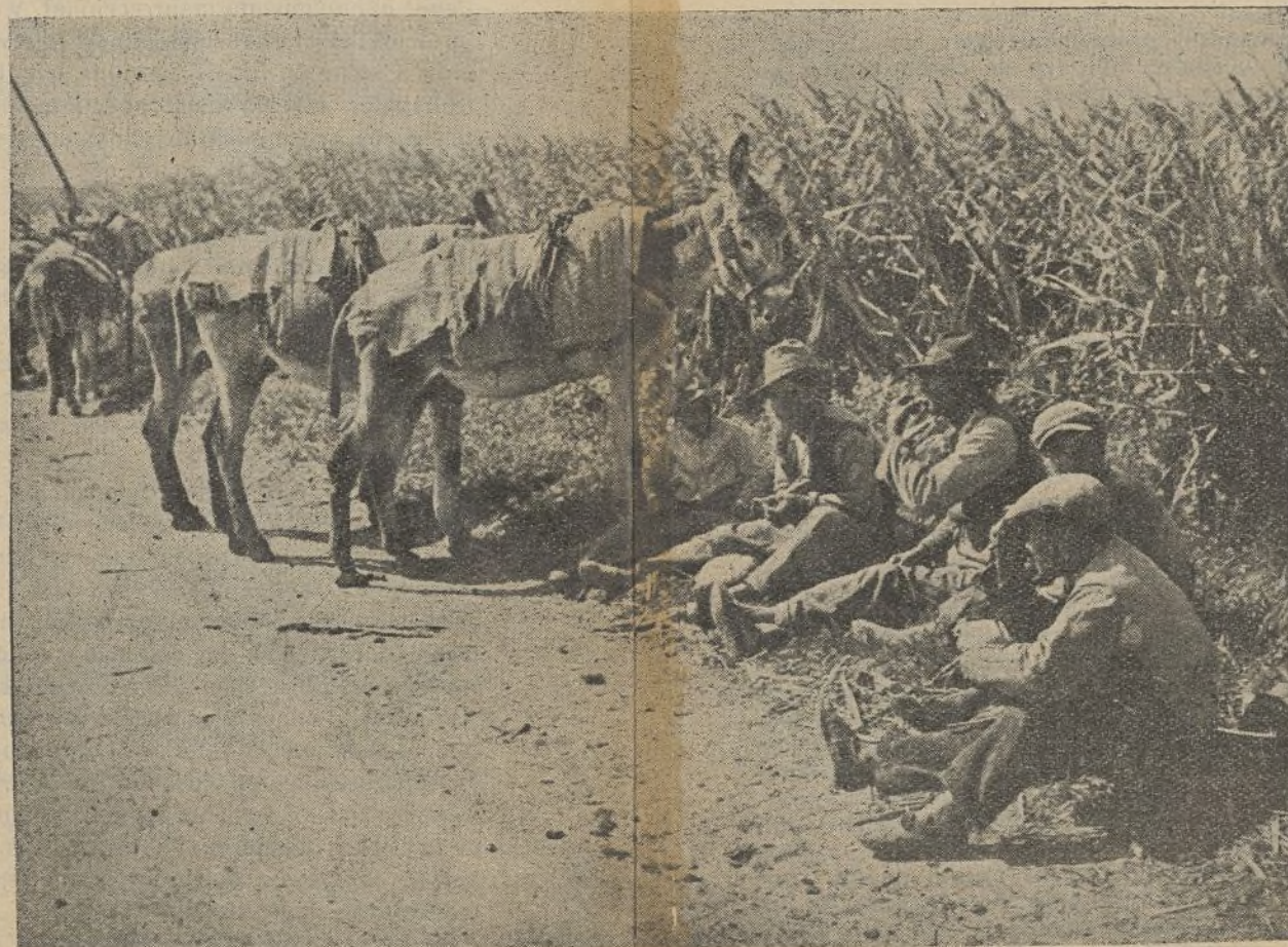
Un reposo en la cosecha de la caña; faena que les corta las manos y se las tiñe de su propia sangre. Sin embargo, aún hay canallas regateando el derecho de vivir a los campesinos.

En la Juventud los militantes del Partido han de desarrollar la labor de orientación que se impone, porque los jóvenes no han de obrar por separado, como cosa aparte. Hemos de estar constantemente con ellos y al tanto de la labor que realizan ayudándoles a crear sus centros culturales y deportivos, educándolos revolucionariamente, y al igual que el Partido de hacer labor de masas, la juventud tiene en esto un gran papel que desarrollar, creando asociaciones para la atracción de toda la juventud laboriosa del país.