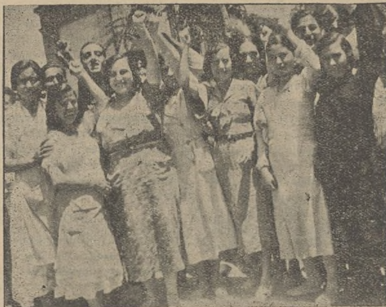
Las muy simpáticas obreras de la Fábrica del Tabaco, nuestras hermanas proletarias, ante el objetivo

Ha tocado la sirena del segundo turno; con toda rapidez tiramos tres placas, y no tenemos la suerte de acertar bien en ellas. Estrechamos la mano de estos trabajadores que luego al separarnos saludan con el puño en alto y el profundo y humano U. H. P. de los proletarios.