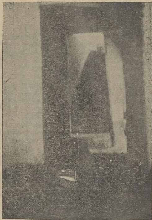
Ya se sabe para quién es esta casa: para los trabajadores, para sus hijos que languidecen en ella

Por la rebaja de los alquileres; por la higiene y limpieza de las viviendas; por la desaparición de los fiadores y fianzas; por el dispense de alquiler de los obreros en paro forzoso