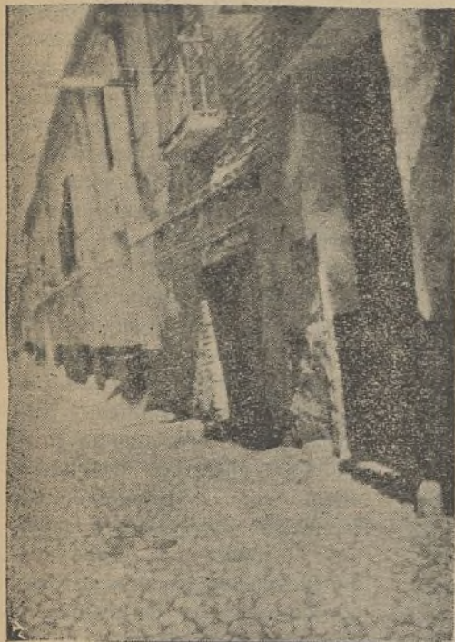
Ya se sabe de quién es esta calle: de trabajadores, de sus hijos que se crían en ella