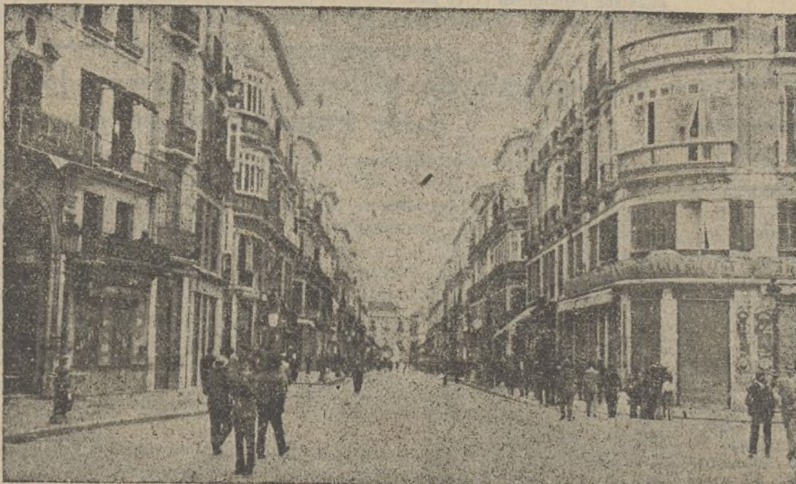
La huelga de dependientes unánimemente seguida ha paralizado todo el nervio comercial de Málaga. He aquí el centro arrogante y burgués de la ciudad, cuyos ensoberbecidos «amos» tendrán que tragar por esta vez...