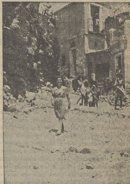
Estas son las calles y casas donde nacen, se crían y languidecen los obreros malagueños

El herido de ayer en la cárcel por las balas de la canalla fascista, ha mejorado algo dentro de la gravedad en que se encuentra.