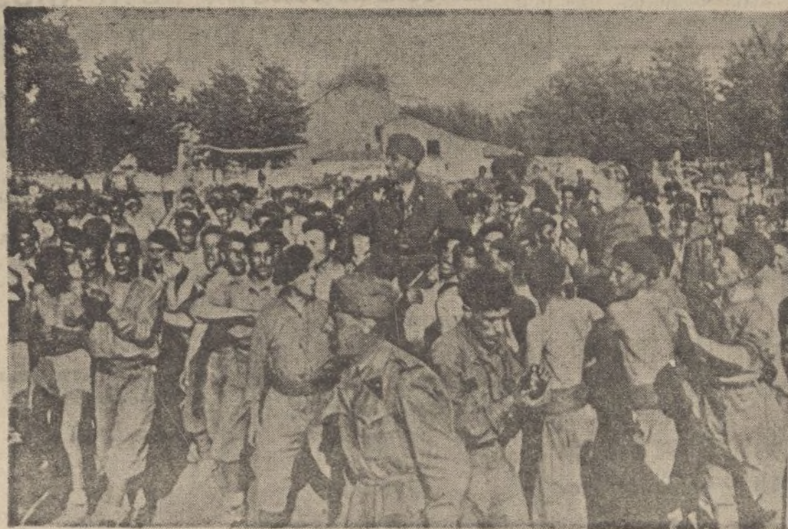
Júbilo de los soldados legionarios y «flechas negras» al conocer la noticia de la caída de la capital montañesa