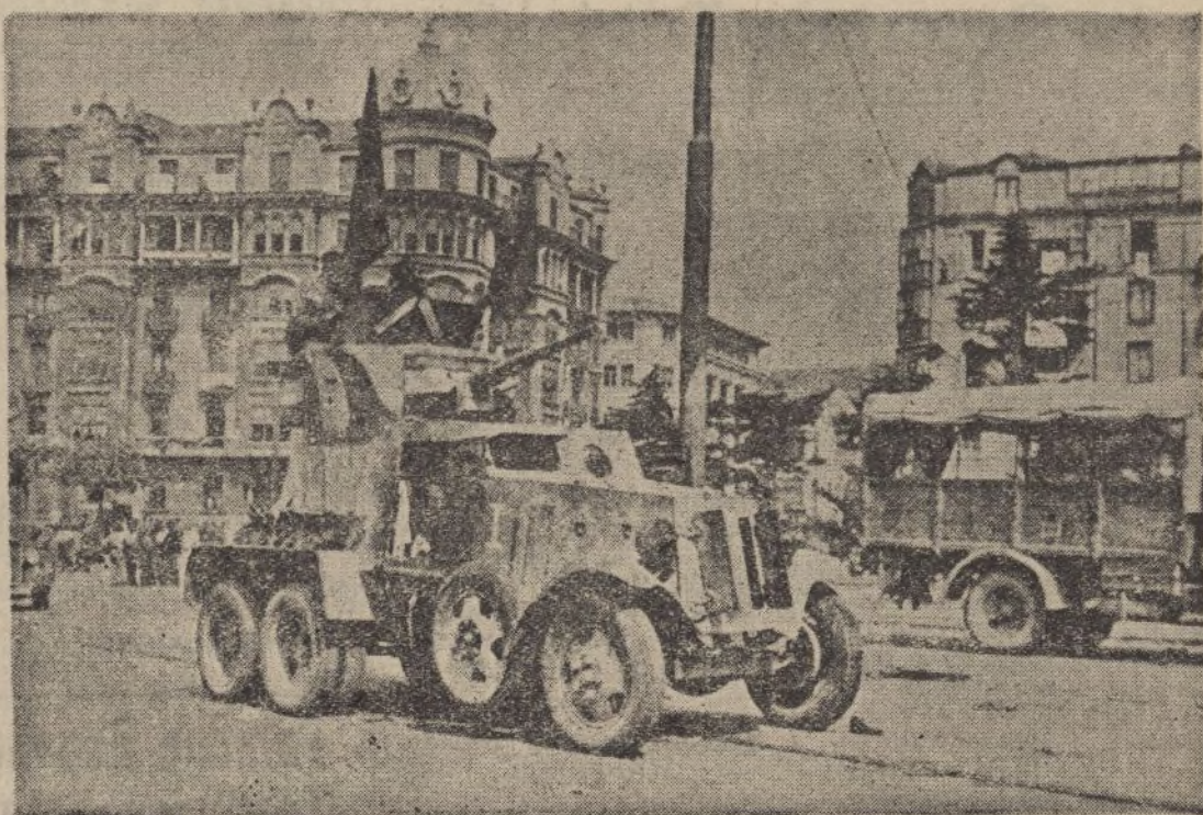
La entrada de autos blindados en la ciudad con el pabellón nacional.

de sus robos y saqueos, dejando a los pobres milicianos que siguen poniendo el pecho cuando lo piden—al alcance de nuestras balas para caer muertos, heridos o prisioneros. Pero bien merecido se lo tienen por criminales y, sobre todo, por tontos. Bien se tienen ganada esa dura lección los fierrecillas rojos de la región asturiana.