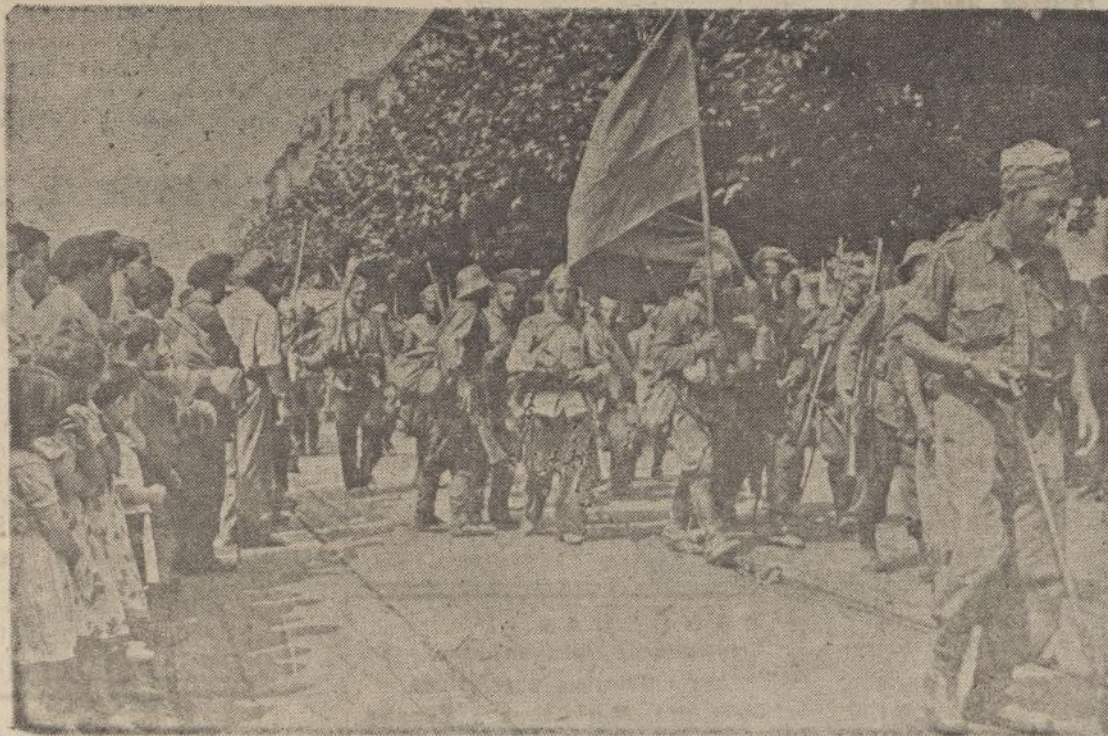
Las primeras fuerzas de Infantería del Generalísimo Franco a su entrada en la ciudad