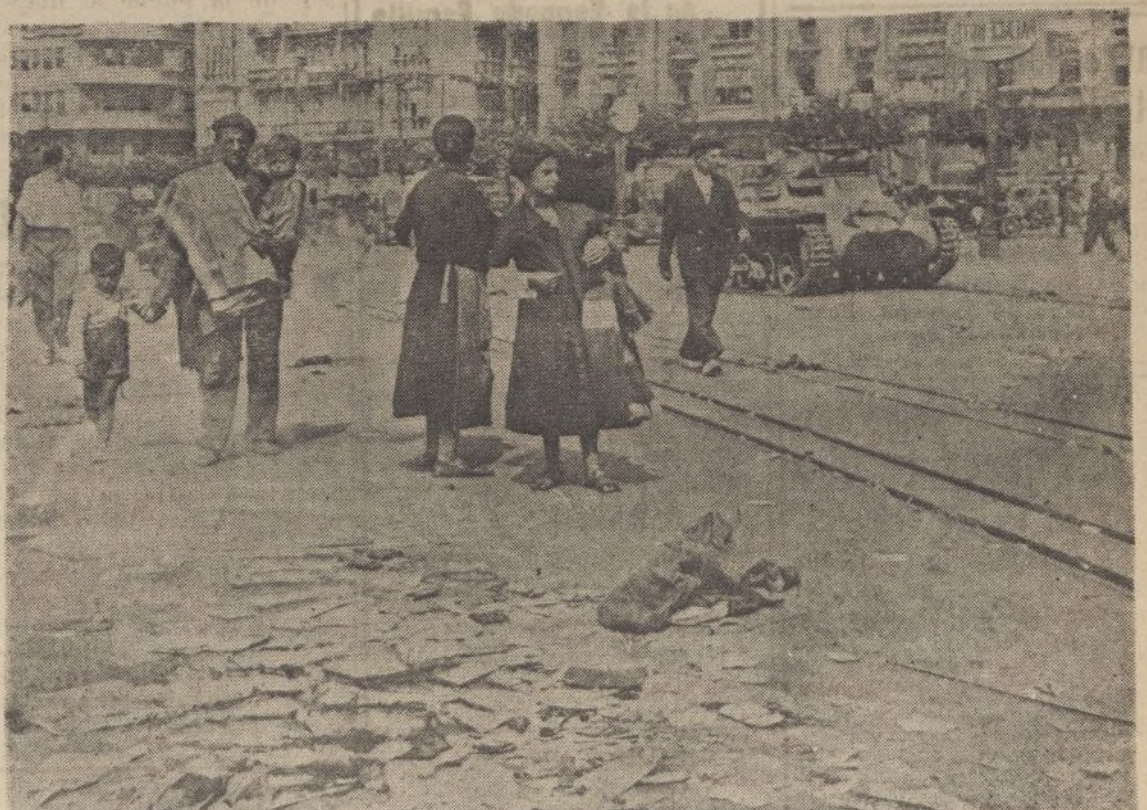
SANTANDER.—Los carros de asalto de las tropas nacionales entran en la capital de la Montaña sin el más leve contratiempo

Todos los domingos y fiestas de precepto a las 9 y media.