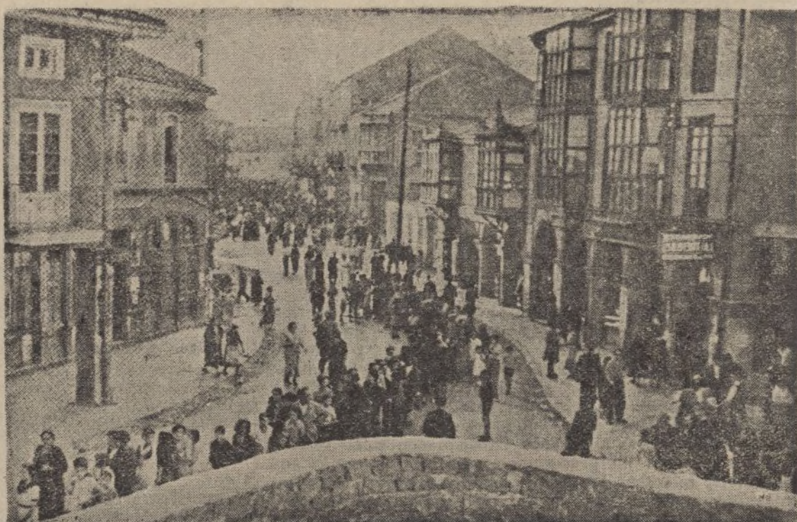
La población civil forma largas colas para recoger los víveres que distribuyen las autoridades nacionales.