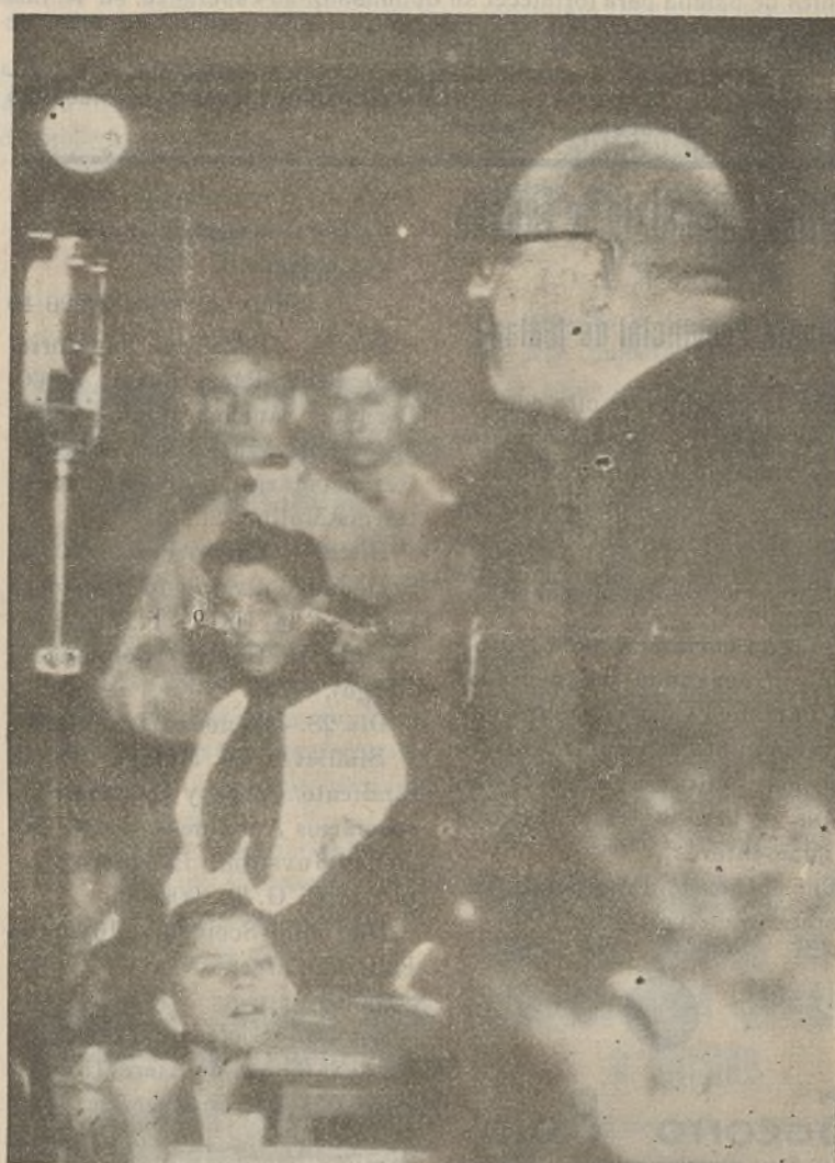
Nuestro camarada Bolívar, rodeado de pioneros y de jóvenes, en una de sus alocuciones al pueblo. Este escucha ávido la autorizada palabra del antiguo y entero luchador, la misma palabra valiente que, sola, se alzaba durante el bienio negro, en pleno Parlamento, para llamar por su nombre a los asesinos del pueblo, enfrentándose y desafiando con palabras y puños a toda la camarilla reaccionaria del Congreso. La voz que hace oír el camarada Bolívar, es la voz del Partido Comunista, que siempre supo ser la orientación firme y valiosa del proletariado para hacer frente a sus enemigos y para conducirlo hacia sus victorias. El tiempo siempre ha dado razón al Partido Comunista, porque sus consignas todas, las ha hecho al fin suyas la clase trabajadora entera y con ellas ha conseguido vencer.

¡Que no haya un solo hombre útil sin conocer la instrucción militar y el manejo del arma sin estar encuadrado en uno de los batallones de reserva de su organización política o sindical!