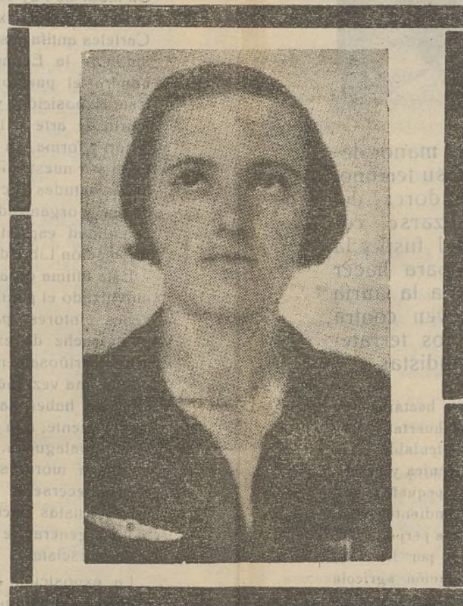
La gloriosa Lina Odena, cuyo recuerdo preside el ánimo de nuestros combatientes, que se han juramentado vencer a los enemigos de la clase trabajadora y no cejarán en su empeño hasta conseguirlo

México, inicial de la rebelión está a nuestro lado, sin discusiones ni vacilaciones, material y moralmente. Nuestro orgullo de hoy es hincar el pecho y gritar, lanzar a los cuatro puntos cardinales del mundo, nuestro espléndido ¡viva México!, grito que expone toda la consideración del pueblo español para ese otro pueblo por excel-