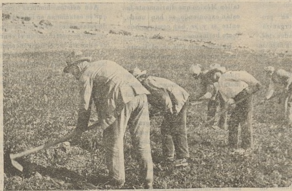
¡Procuremos que todo el suelo de España produzca, que ésta es la mejor garantía de la victoria!

Art. 3.º A efectos de este Decreto, se considerarán como bienes rústicos los que figuren inscritos como tales en el Registro de la Propiedad, los no inscritos que por su producción agrícola-pecuaria tengan ese carácter; las industrias rurales, con sus útiles y edificios; los montes, las tierras de pasto y cotos de aplicaciones industriales o deportivas y las fincas de recreo que tengan arbolado, matorrales,