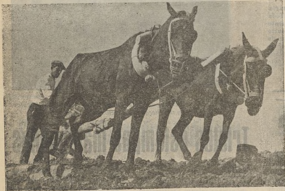
El campesino que trabaja es tan útil a la causa como el mismo combatiente que está en la trinchera

Ayudar a los campesinos que viven del producto de su trabajo, es un deber de todos los trabajadores revolucionarios.