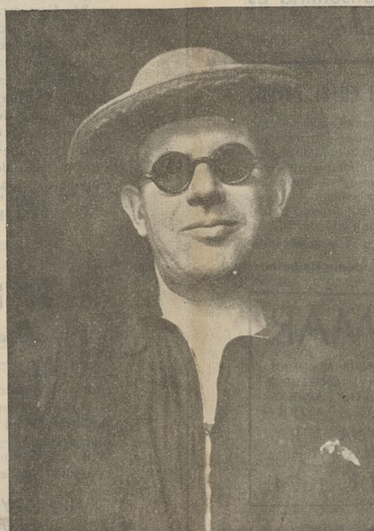
Nuestro infatigable director, camarada Bolívar que no para un solo instante desde su puesto en la Comandancia Militar o desde los frentes que recorre velando por la seguridad del sector

Washington, 12.—La prensa comenta el acuerdo de mediación de los asuntos de España y se adhiere a la iniciativa frenco-británica. Se acuerda que el departamento de Estado publicará muy pronto una declaración oficial sobre este grave asunto.