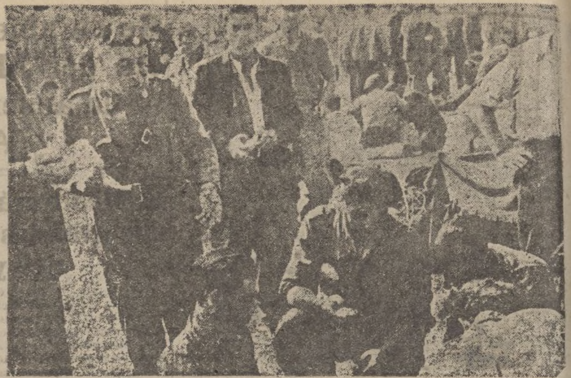
SANTANDER.—El médico jefe del campo de prisioneros, inspeccionando la comida que se ha servido.