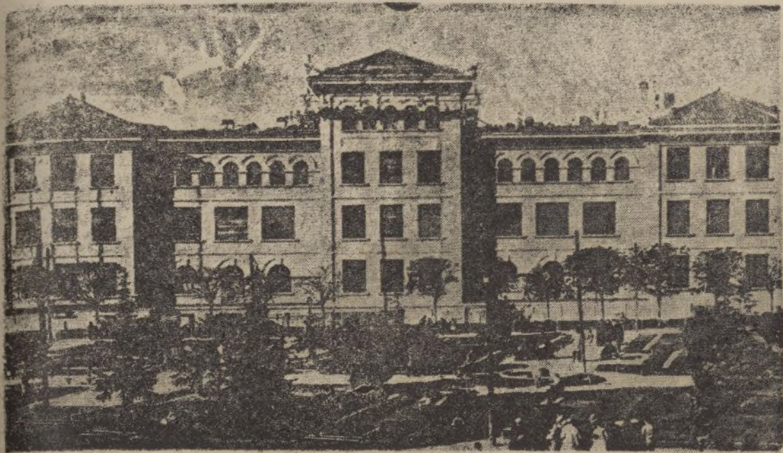
Magnífico grupo escolar construido en los terrenos del antiguo Hospicio de Madrid

Quando entremos en Madrid, en esta gran urbe pecadora, alegre y celebrada en otros tiempos, tan desgraciada y triste en estos momentos, ¿cómo encontraremos esas escuelas?