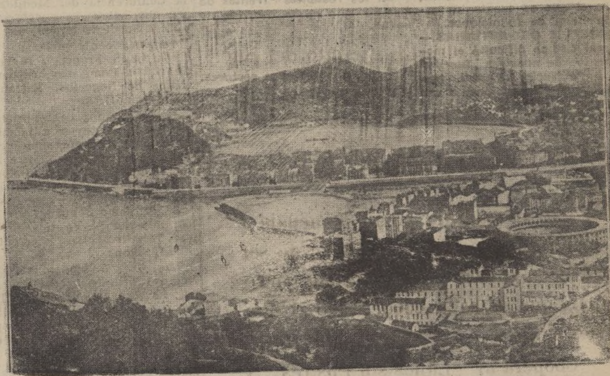
Vista general desde el monte Ulla

Ejército de Franco, sería esfuerzo inútil y acarrearía, en cambio, la ruina de la ciudad encantadora y pulcra, tuvieron a raya a los foragidos extremistas que no les importaba la destrucción y el saqueo, y San Sebastián fué conquistada fácilmente, entrando nuestras invencibles tropas el día 13 de septiembre, franqueando así el posterior avance hacia Bilbao