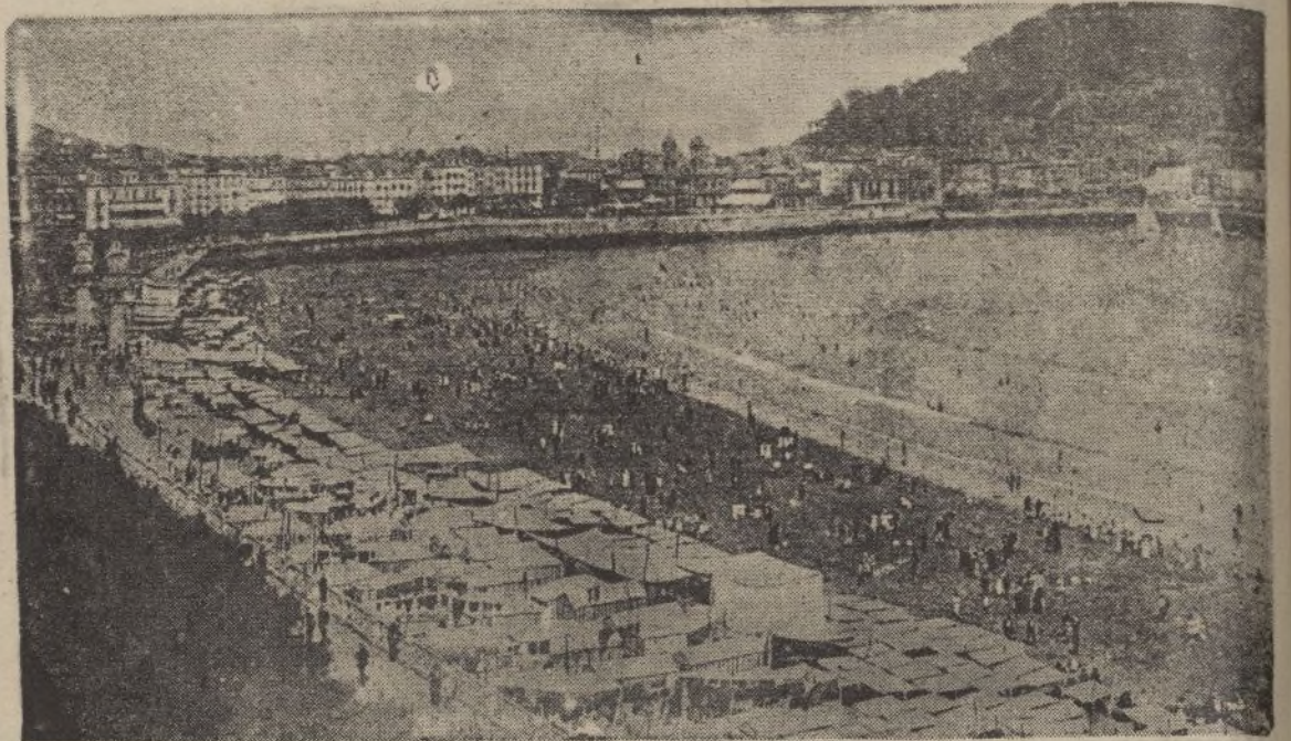
Playas de la Concha