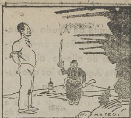
SANGRIENTA TRINIDAD —Yo te fusilo en el nombre del Führer, del Duce y del general Franco.

Hemeroes Municipal Aparado 12 155 Madrid