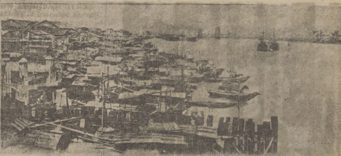
ARRABALES DE CANTÓN

Primo de Rivera, aparecía completamente llena de una inmensa muchedumbre, un público heterogéneo en el cual predominaba el elemento obrero.