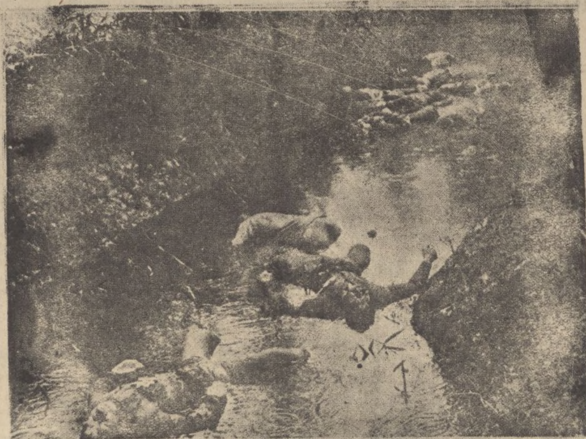
Cadáveres chinos en los fosos que bordean el aeródromo de Nanyan después de un bombardeo por la aviación japonesa.