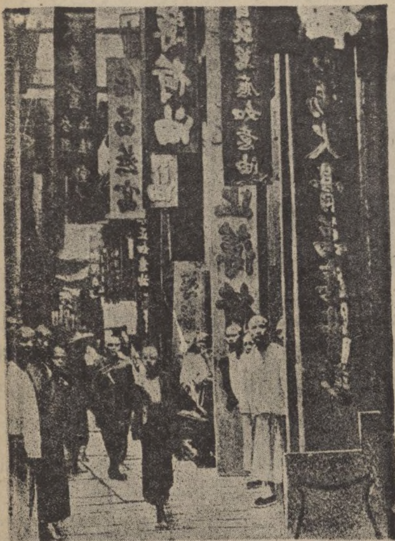
UNA CALLE DE CANTÓN