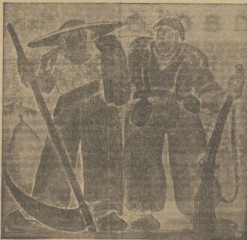
Lluitem junts perquè el poble pugui menjar

Les disposicions del Govern s'han de fer complir inexorablement, s'han de portar a la pràctica plenament i ràpidament, costi el que costi, caigui qui caigui. Cal complir i fer complir la legislació de la Conselleria d'Agricultura. No es pot permetre que encara hi hagi qui es pensi que les Lleis només serveixen per anar al "Diari Oficial" com aquell qui edita una novella per "entregues". No es pot tolerar que s'accepti que es promulgui un Decret, però que no s'accepti que es compleixi.