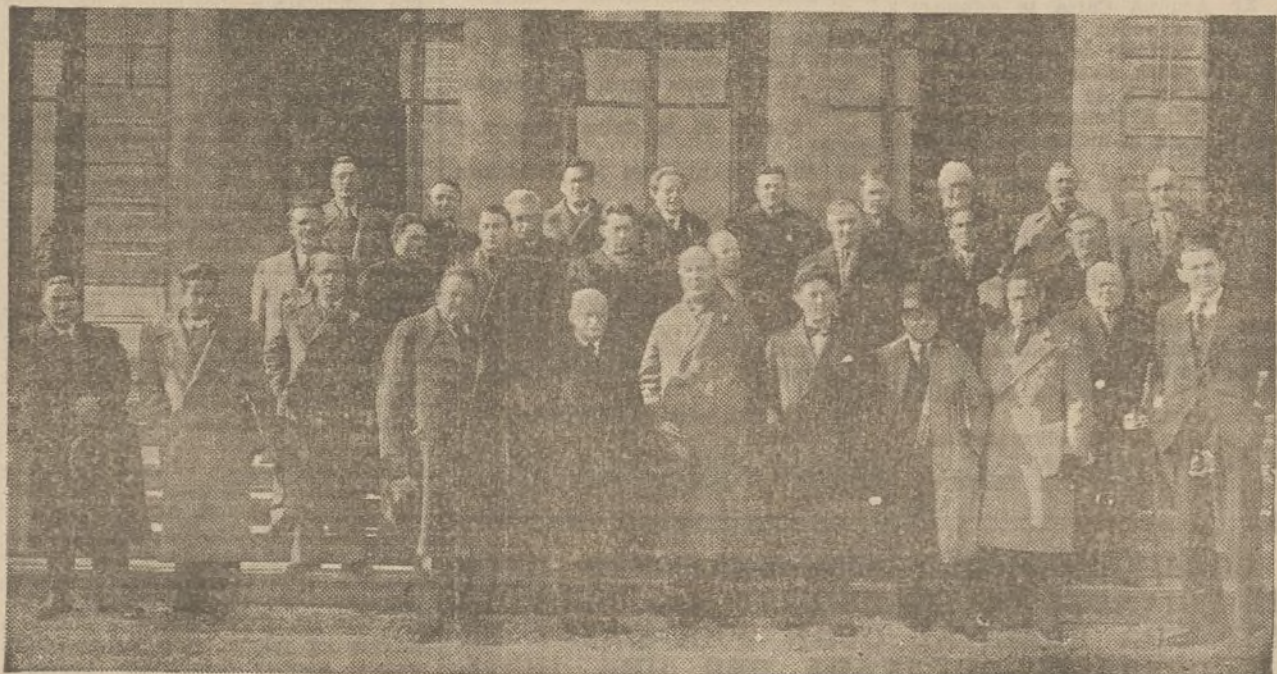
Grup de delegats de diferents nacions que van assistir a la Conferència Internacional Pagesa i en el qual figuren els delegats catalans i espanyols

Dintre de poc es reunirà el "Rassemblement Universel pour la Paix" a Londres. És possible que la reunió següent es faci a Espanya. Es va a crear un formidable aparell mundial de propaganda a favor de la pau, que arribi a totes les capes populars. Es vol aconseguir que a la Societat de Nacions no hi estiguin representades únicament les diplomàcies, fredes, i gairebé sempre inoperants, sinó que les grans organitzacions populars aportin la veritable passió pacifista que ens porti a fer impossible la guerra.