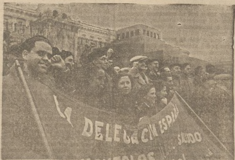
La Delegació espanyola a la Plaça Roja de Moscou, presenciànt la desfilada de l'Exèrcit i del poble amb motiu del XX aniversari de la U. R. S. S.