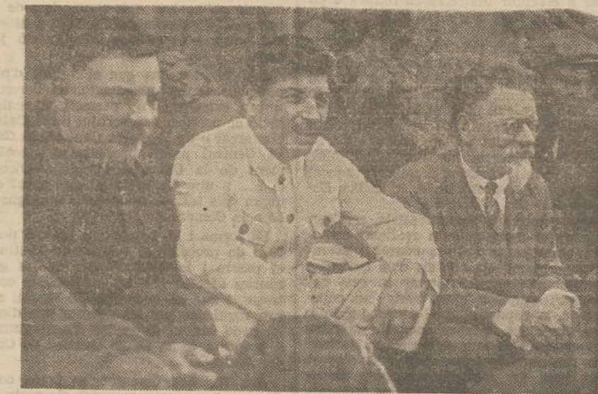
D'esquerra a dreta: VOROTNIKOV, cap de l'Exèrcit Roig; STALIN, secretari general del Partit Comunista; KALININ, President de les Repúbliques soviètiques

1921, 11.600 el 1924, 28.000 el 1930, 40.000 el 1932, i 85.000 el 1936. L'Estat, durant l'any 1933 ha gastat en noves construccions i en l'embelliment de la ciutat 12 milions de rubles; durant el 1934, 77 milions; durant el 1935, 84 milions, i és projectat per al nou pla quinquenal l'esmerç de 1.140 milions.