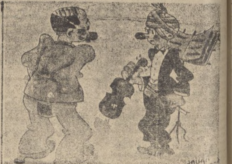
LÓGICA, por Naval

Según otras noticias recibidas en el mismo Perpignan, se teme en Barcelona un nuevo levantamiento, y se dice que hay treinta mil fusiles escondidos que podrían decidir la situación.