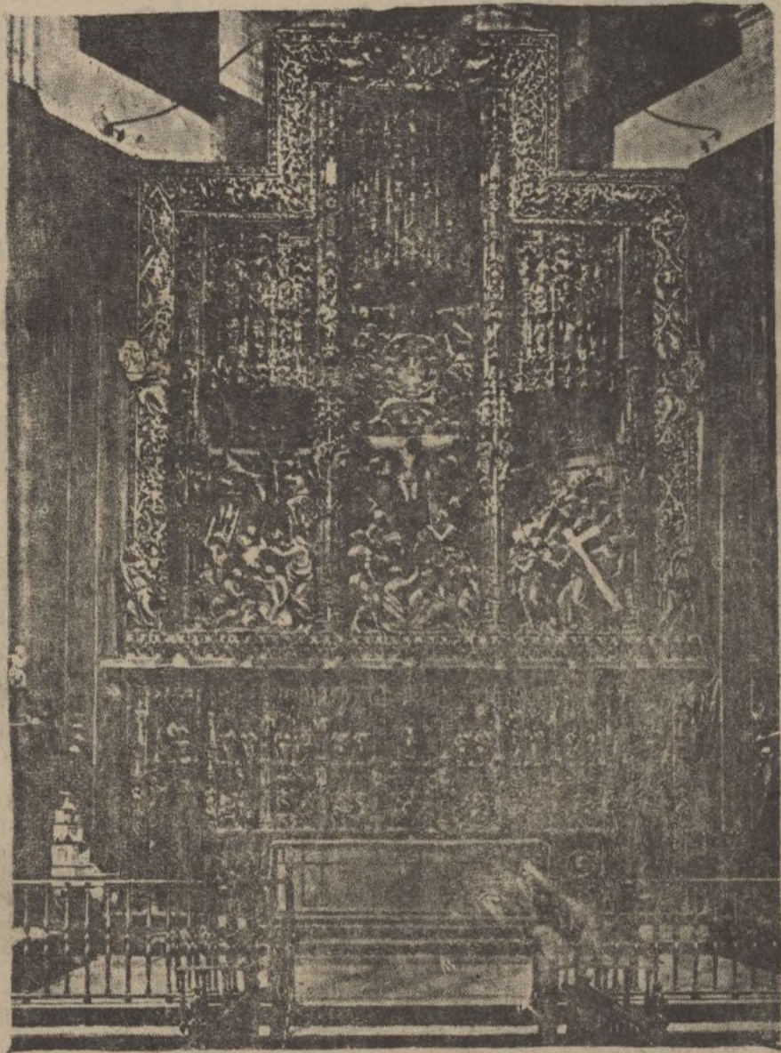
Grandioso retablo de la Catedral :

impetuosos, a los rojos a huir a la desbandada. Es preciso subrayar el gran alcance de esta operación, que influirá, sin duda, en la marcha de las operaciones sobre el terreno asturiano, las que se llevan con una velocidad tal y, sobre todo, con una concatenación tan perfecta, que revela una táctica militar de calidades excepcionales.