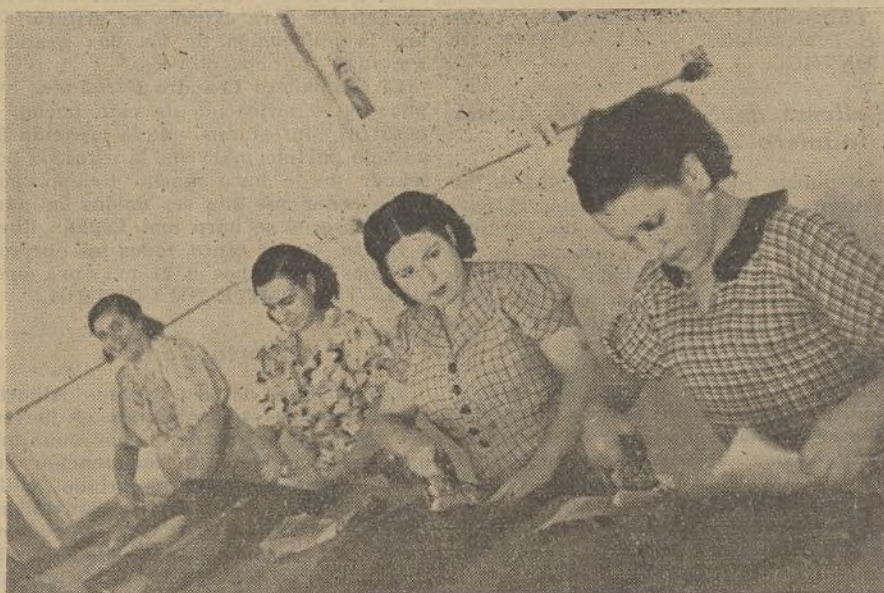
Obreras planchadoras de El Sol-Flomar's: «La unidad de la clase trabajadora es necesaria para la victoria.»

Con una disciplina en el trabajo y una compenetración estrecha entre todos los compañeros del taller o la fábrica conseguiremos la victoria.