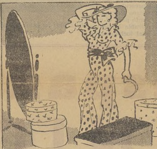
... se confecciona un pijama para estar hecha una dama.