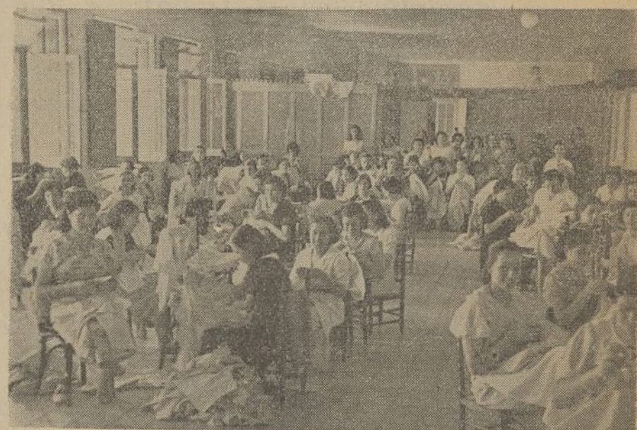
El Partido Unico del Proletariado es la aspiración inmediata de las modistas de Abascal

Se adhieren con entusiasmo a la campaña pro Partido Unico del Proletariado, por considerarlo necesario y de importancia para la clase trabajadora.