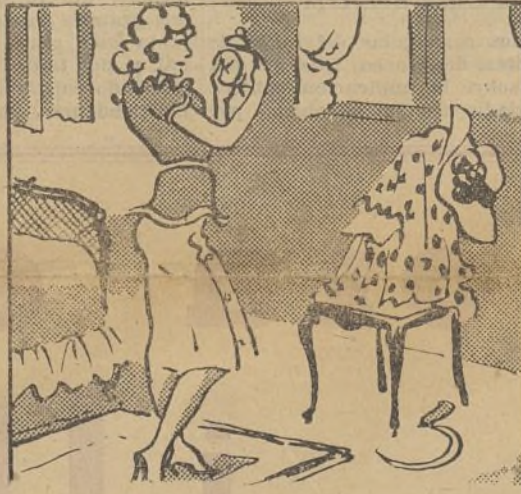
A las siete hay que salir. ¡Eso ya es mucho pedir!