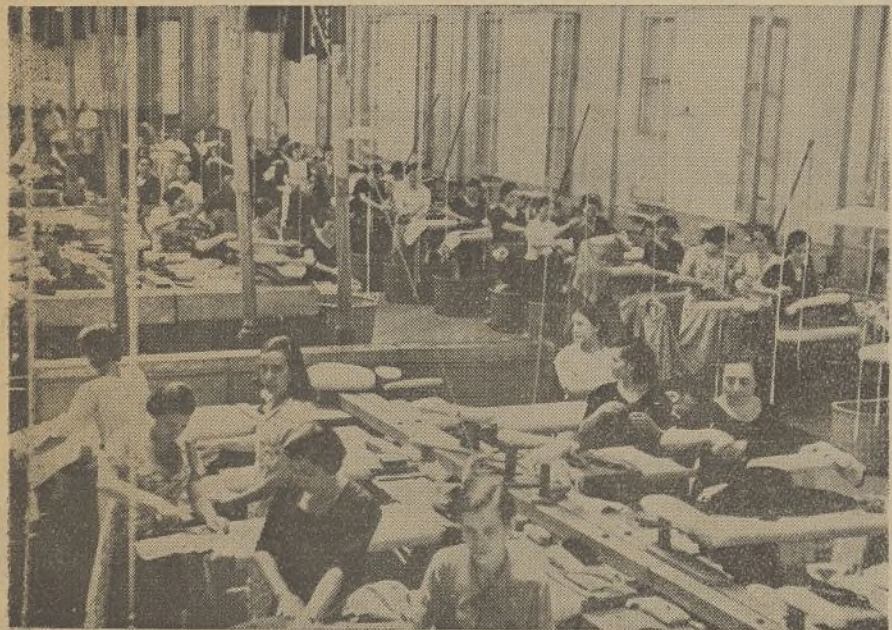
«De la unión de todos los que producimos depende en gran parte el que expulsemos al invasor extranjero.» (Personal de la Tintorería Moderna.)

Reunidos todos los obreros de esta fábrica, y puesta de manifiesto la necesidad de que se cree un Partido Unico, coincidimos todos en que la creación de dicho Partido se debe llevar a cabo cuanto antes, dada la importancia que éste reviste para el porvenir de todos los trabajadores, y deseamos que en