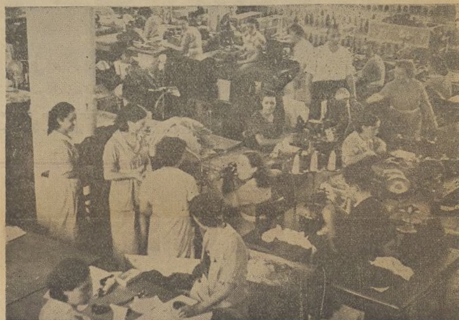
«Porque unidos venceremos al fascismo», dicen las trabajadoras del Colectivo Quirós