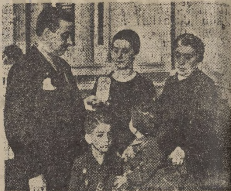
El Sr. Fal Conde en el acto de la entrega de la Medalla de Sufrimiento por la Patria a la viuda del General Sanjurjo, que aparece en el cliché acompañada de sus hijos

Cumple sin excusa el precepto del «Día del Plato Unico» que sirve para hacer llegar el pan y la lumbre, a los hogares de quienes todo lo dejaron para defender su Patria.