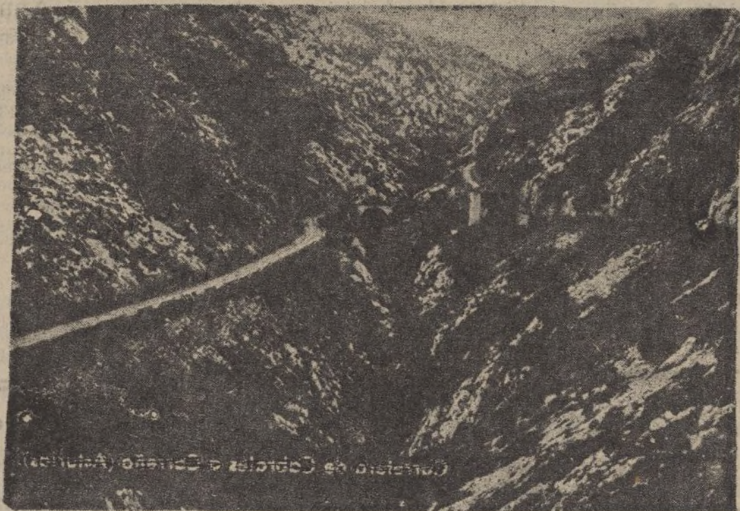
Carretera de Cabrales a Carreño

esto era tema de importancia para el Frente Popular, que quería destruir a nuestra Patria, preparando el camino a España para convertirla en una colonia de Moscú, desesperando a los obreros para tenerlos propicios cuando llegase el momento oportuno.