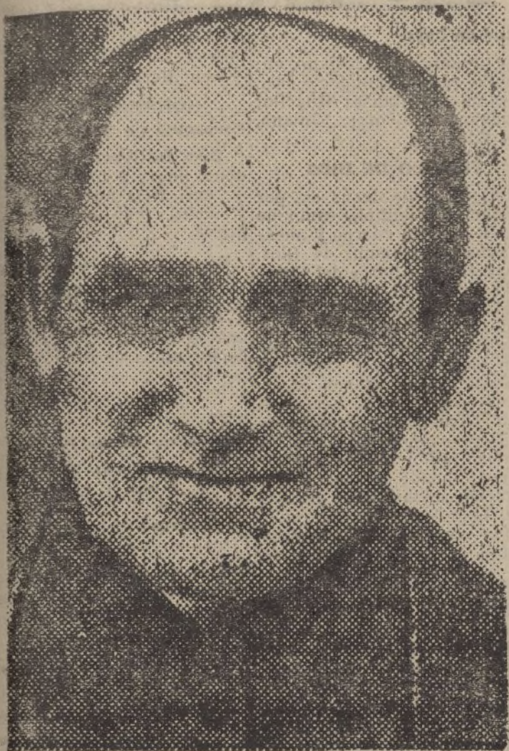
Por Cayetano MORENO.

El generoso corazón de la España católica late jubilosamente, invadido de legítima satisfacción interior. Al fin, la Justicia de la que tan necesitados nos hallábamos todos los que en tiempos de imperio y predominio del nefasto Frente Popular habíamos cometido el «delito»—horrible delito en aquellos tiempos— de percatarnos de la trágica e indignante farsa que se venía representando en nuestro solar patrio, con el beneplácito de los que en todo tiempo han sabido ocultar con hipocresía maestra los funestos sentimientos que agitan sus almas perversas, ha venido a alumbrar poderosamente el recto camino de la verdad, sumiendo e impenetrables tinieblas los tortuosos senderos de la perfidia.