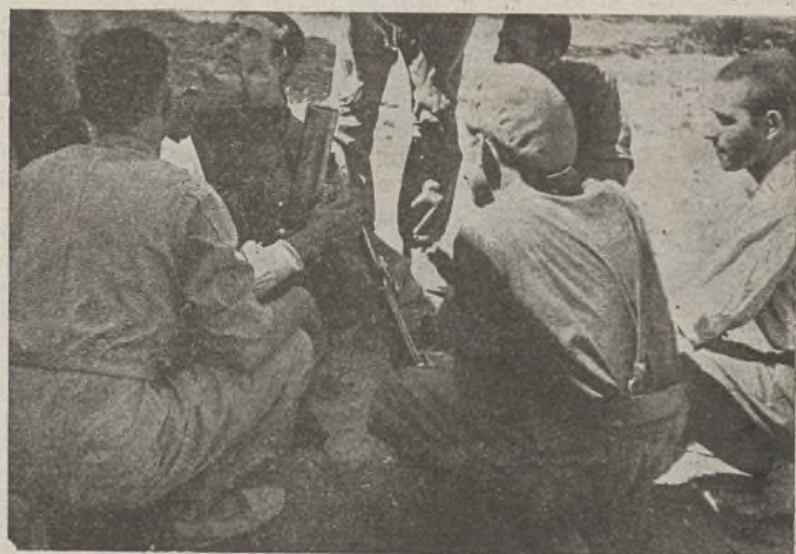
Nuestros soldados mejoran cada día su conocimiento en el manejo de las armas. Saben que el dominio de la técnica es factor importantísimo para el triunfo, y no descuidan su estudio. Ved con qué atención estos camaradas escuchan una explicación sobre el funcionamiento de un mortero.

Ya lo sabéis, camaradas. Acudid a esta sección si tenéis algo que consultar.