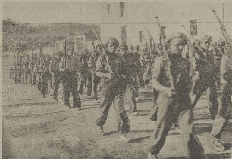
Los reclutas van adquiriendo ya el aspecto y la firmeza de nuestros curtidos veteranos. Pronto estarán capacitados para ocupar un puesto junto a los viejos combatientes.

Sargento de la 2.ª Compañía del 96 Batallón.