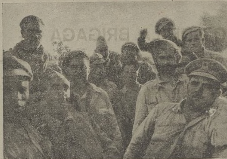
Estos camaradas, pertenecientes al Segundo Batallón de nuestra Brigada, realizaron hace unos días una audaz incursión por territorio enemigo, capturando a dos fascistas y matando a otro que intentaba huir, del cual se trajeron el cadáver. Nuestros camaradas fueron muy felicitados por el Mando.