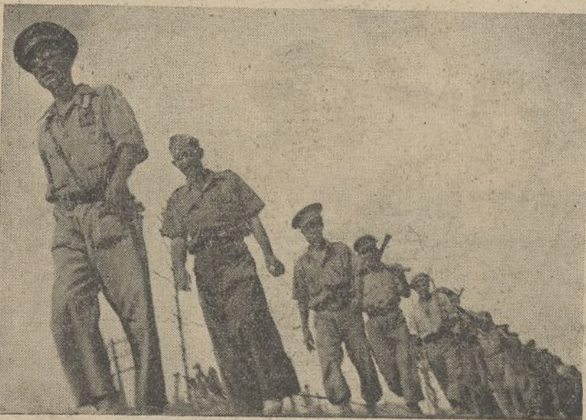
Amanece. Nuestros valientes zapadores regresan a su destacamento después de haber realizado durante toda la noche labor abnegada y heroica.