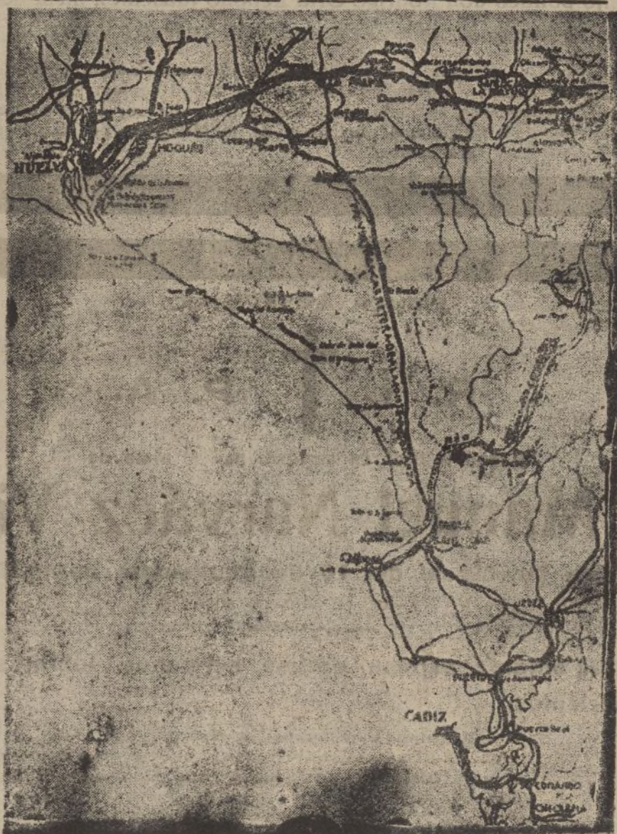
Gráfico de la costa y parte de la provincia de Huelva que se une con Cádiz. La línea negra que se destaca al centro señala el trazado de la carretera de Almonte a Bonanza

En cuanto al tráfico de viajeros, las ventajas no se ocultan tampoco. El viajero que para asuntos comerciales, o particulares, o simplemente turísticos, tiene que ir de Huelva a Cádiz, o, al contrario, exige y tiene derecho, porque para eso paga, a las mayores comodida-