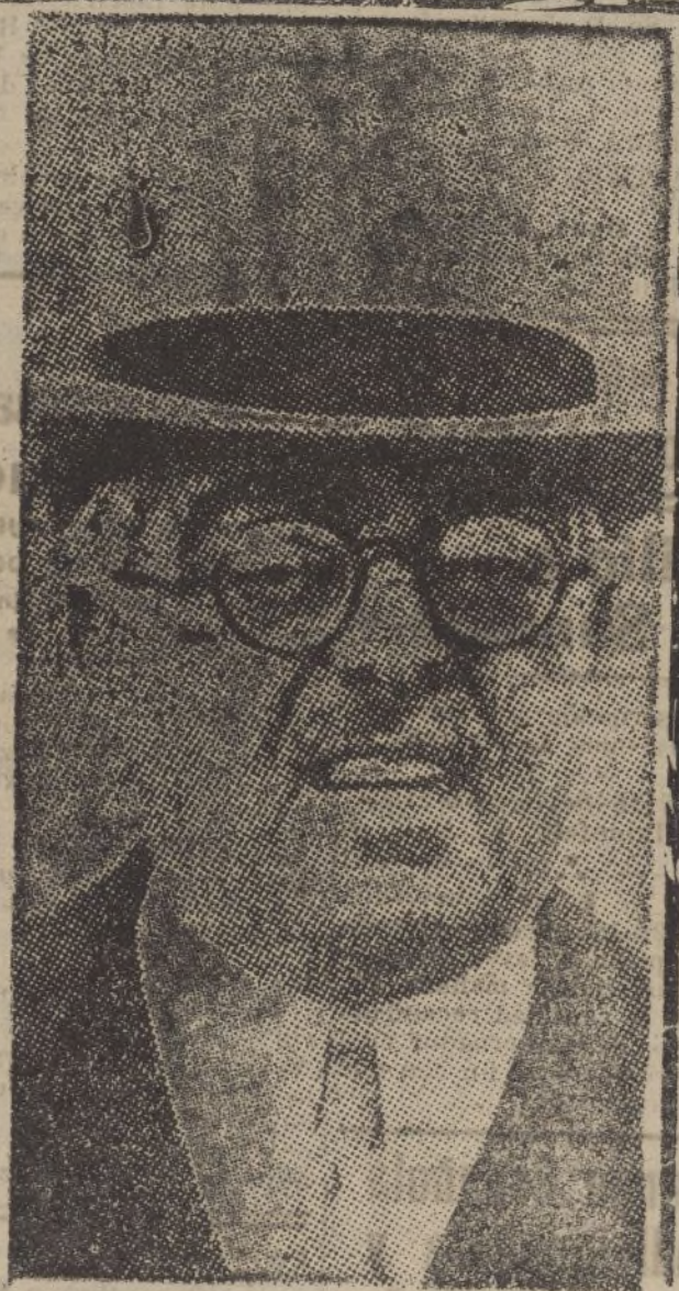
Aga Khan, delegado de la India, que acaba de ser elegido presidente de la Asamblea General de la Sociedad de Naciones

La colaboración de Italia en los servicios de patrullas Mediterráneo facilitará los esfuerzos de Chamberlain para una mejora de las relaciones entre Italia, Inglaterra y Francia.