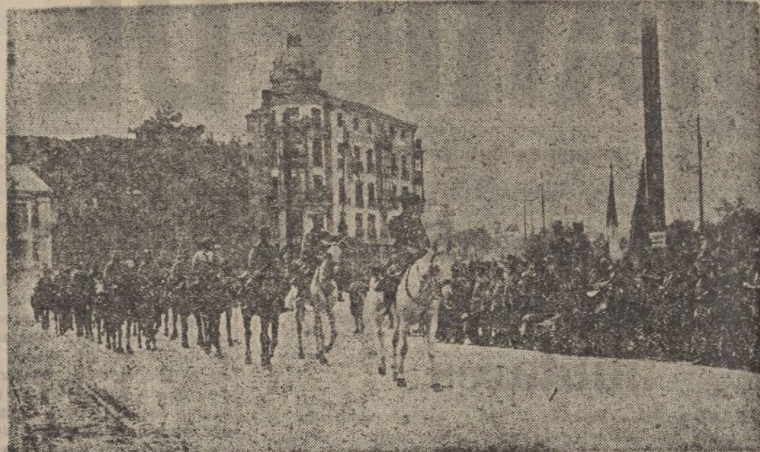
La Caballería española desfila por las calles de Santander, entre las aclamaciones del público