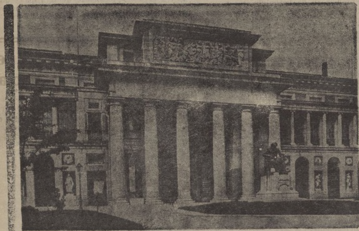
MUSEO DEL PRADO

Sea pues esa ESPAÑA NIÑA que esperamos los hijos de Imperalismo creador y magnífico; pero sea cumpliendo las reglas necesarias para toda grandeza espiritual en los altares de los pueblos, dedicados a cultivar su tipo propio que siempre resultará mejor que la mejor imitación del extranjero y recordando que no hay poner vino nuevo en odres viejos, sino en aquella proporción que convenga para «conservar y aprovechar solares». S. P. E.