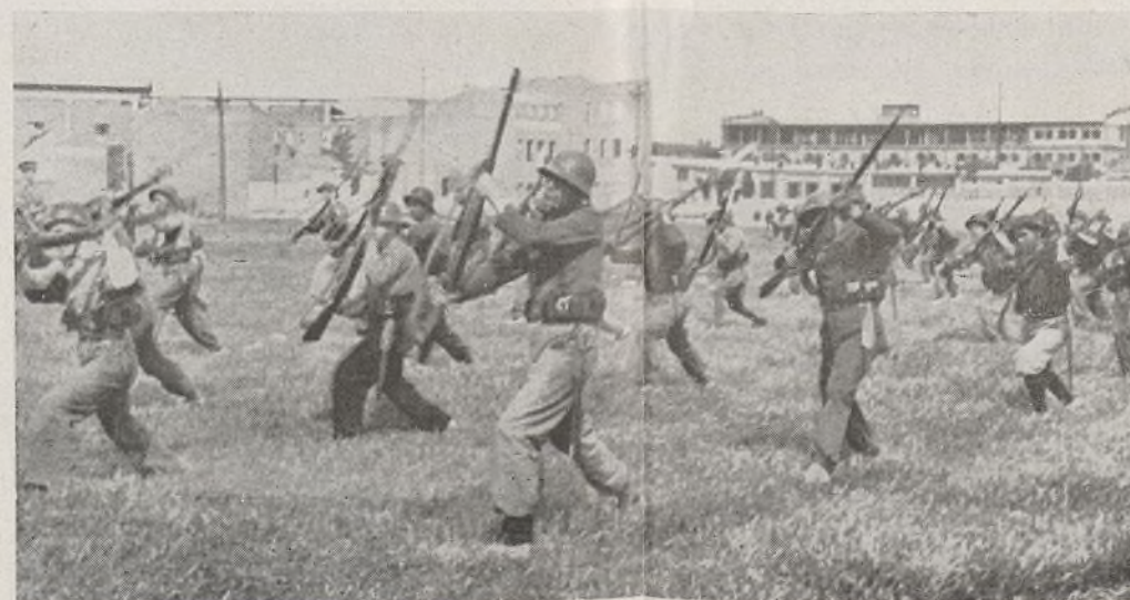
Ayuntamiento de Madrid