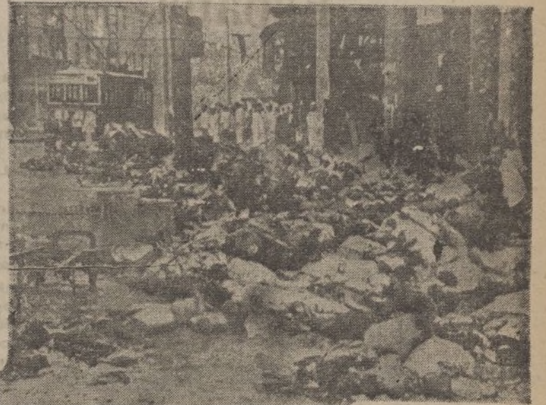
Tres notas fotográficas de los efectos del bombardeo de Shanghai por la aviación japonesa