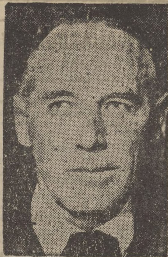
El almirante inglés Chatfield, autor del plan de fiscalización en el Mediterráneo.