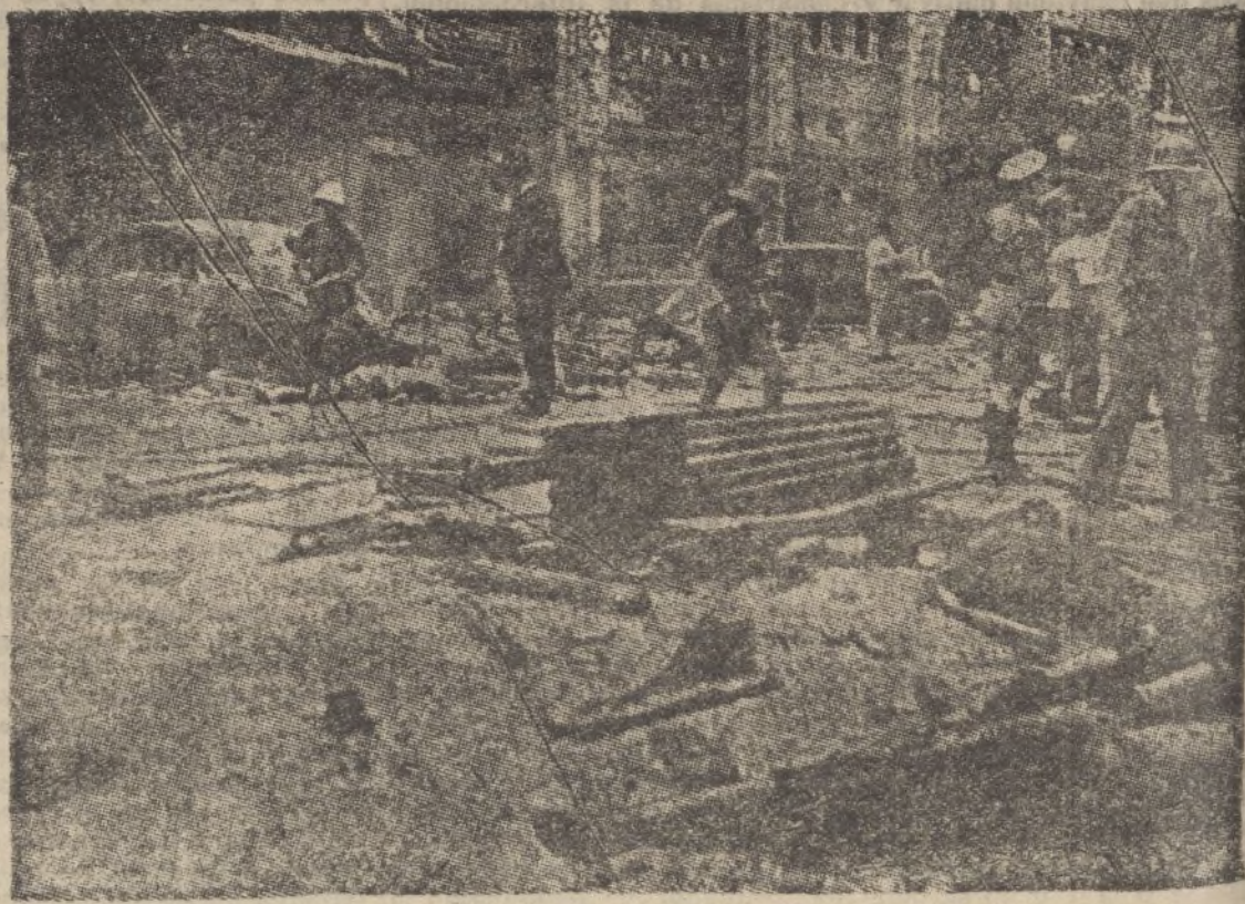
Un aspecto de Nankin Road, en Shanghai, después de ser bombardeado por un aeroplano japonés