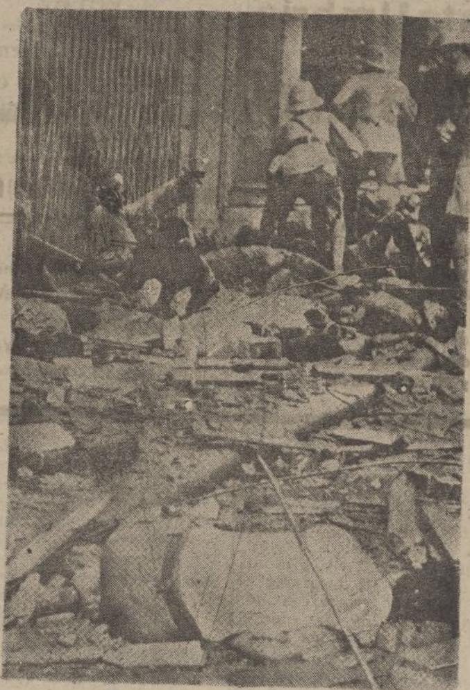
Cadáveres de transeúntes sorprendidos por el bombardeo aéreo. Recostado sobre el cierre metálico, la figura de un hombre terriblemente abrasado por la metralla

redactada por un grupo de patriotas que expresan los horrores cometidos por los de Valencia a quienes, como de costumbre les ha escocido la verdad, como siempre que la escuchan.