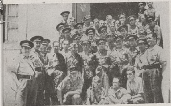
Jefe y Comisario de la División, Director y Profesorado, con los Oficiales que componen el primer equipo de capacitación militar.

a) mi mejor colaborador. Y como consecuencia de esta periódica observación y de este continuo contacto de alumnos oficiales cursillistas, profesores y yo, viene esta manifestación solemne que hago como Jefe del Ejército, y decir que la hago como tal es decir que la hago como hombre honrado, de recta conducta, de entusiasmo y ardor por vuestra causa, y como padre de sus subordinados: Entendido bien, señores oficiales: No es por halago, es por justicia; no es por miramiento ni por pasión, es por verdad, es ésta: