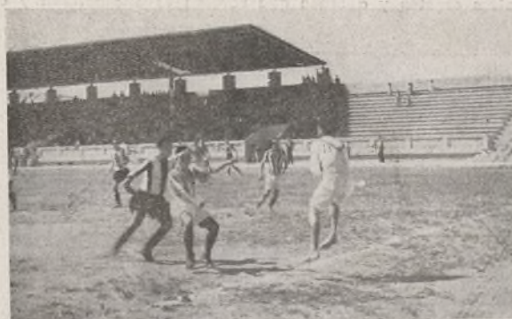
Una jugada recogida en el encuentro de la 41 y 67.

En el intermedio se celebró una interesante prueba de lanzamiento de bombas de mano, interviniendo los equipos de la 41, 42 y 67, consiguiendo la puntuación: de 7, la 41; de 5, la 42, y de 3, la 67.