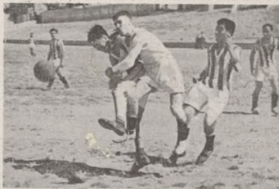
Un momento del campeonato de fútbol de la 4.ª División.

En el segundo tiempo, el dominio es completo por parte de la 41, que en todo momento tiene en jaque a la defensa contraria, y aunque el portero bloquea bien, no puede