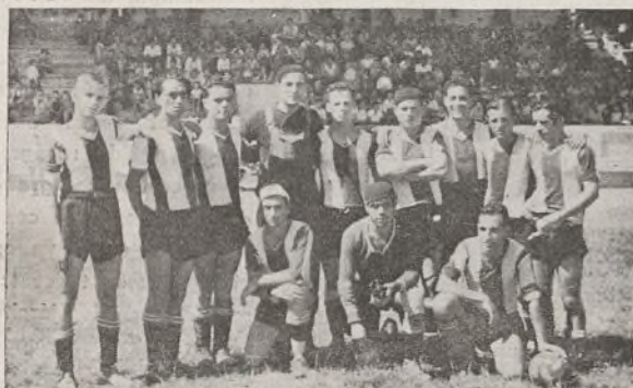
Equipo de la 41 Brigada, que ganó a la 67 por 1-0.

los equipos de la 67 y 42, obteniendo la victoria esta última, por 2 a 1.