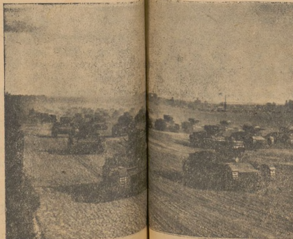
Tanques de guerra del Ejército Rojo.