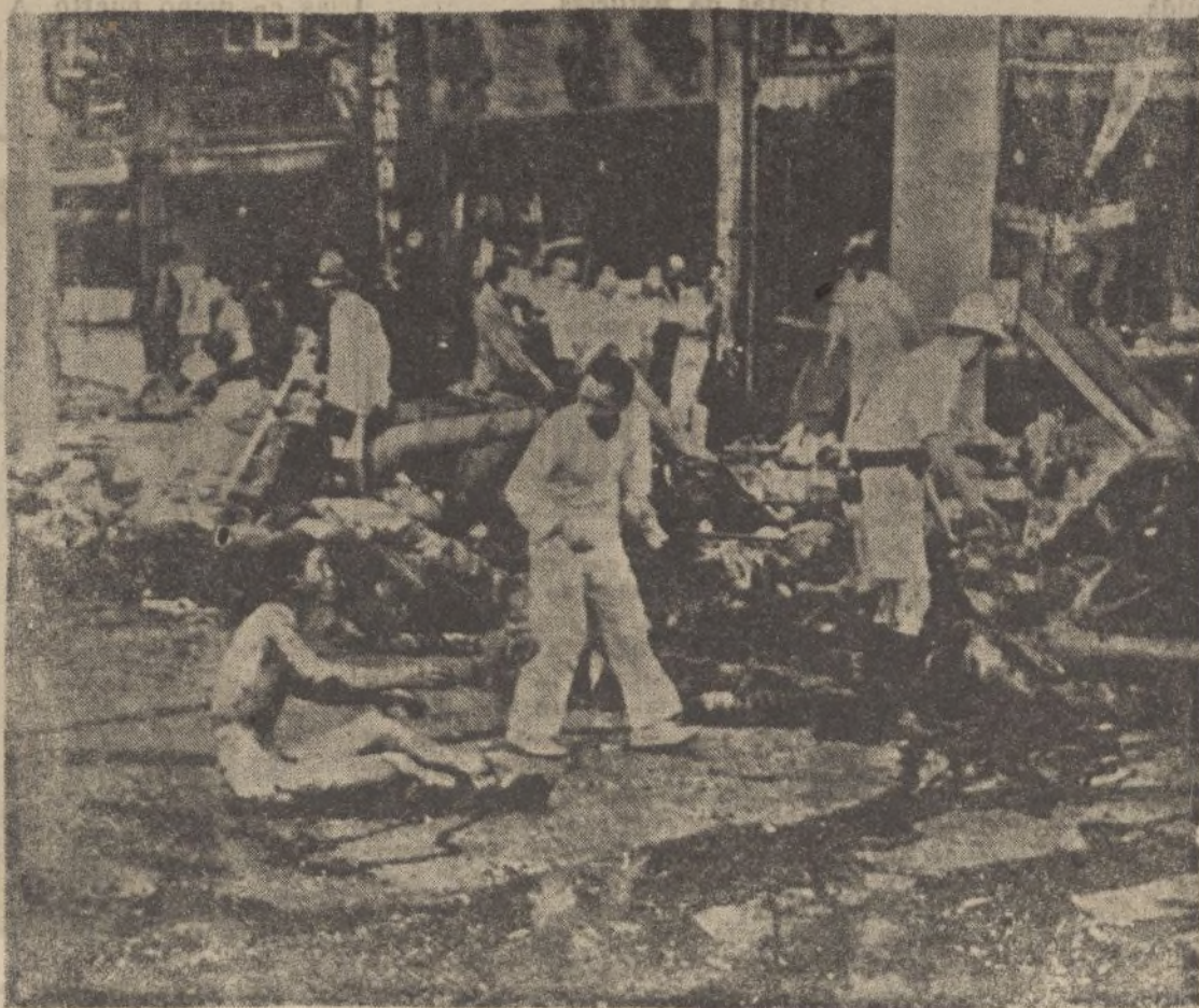
Una escena de los terribles efectos del bombardeo de Shanghai por la aviación japonesa

Con motivo de la designación del Eminentísimo Sr. Cardenal Segura, para regir la Archidiócesis de Sevilla, se ha dirigido por el señor Gobernador civil de esta provincia, al ilustre purpurado, el siguiente telegrama: «Al culto y conocida su designación y por su historia y por su grato recuerdo, la provincia y en nombre todos sus pueblos, dependientes de la Archidiócesis, le ruego acepte cordial felicitación y condecoración paternal bendición.—Besa pastoral anillo. Federico Quintanilla, Gobernador civil.»