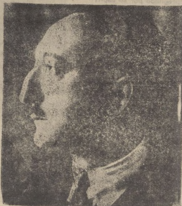
El gran escritor humorista Wenceslao Fernández-Flores, a quien se le creía víctima de los marxistas de Madrid. Afortunadamente para las letras españolas, no ha muerto; pero, según confesión propia, ha vuelto a nacer...

El general Aranda, con su proverbial amabilidad, contestando preguntas nuestras nos ha dicho: «El soldado gallego es el primer soldado del mundo. Los estoy mandando hace más de un año. Hace pocos días se incorporaron a las brigadas gallegas los soldados de una brigada de Castilla también magníficos, por cierto. El soldado gallego es—repito—el mejor del mundo; acaso sea menos elrico, menos marcial, me-