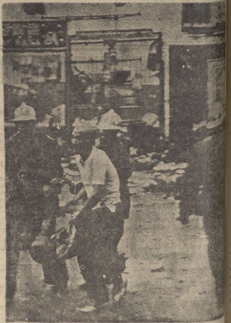
Una escena de los terribles efectos del bombardeo de Shanghai por la aviación japonesa