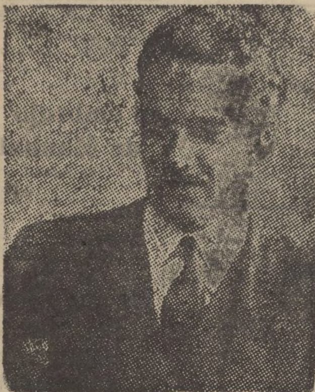
Antony Eden, ministro de Negocios Extranjeros de la Gran Bretaña.