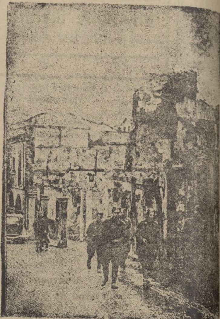
Una calle destruida del pueblo santanderino de Potencia