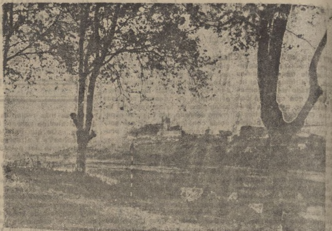
Carretera de Santander a Oviedo