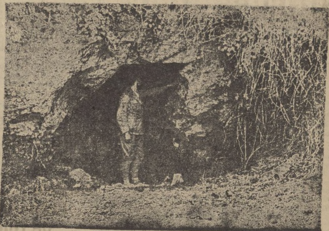
Una cueva, refugio contra nuestros aviones, hallada en nuestro avance

de, sin bordados ni obra de artífice, y se lanza al camino para llegar al grupo de casas que se quedó huérfano de religión. Dice la misa, reza por los caídos y torna al hogar a calentarse los pies con unos troncos de castaño que el monago habrá cortado para su abrigo. La callada labor, el sacrificio, sólo él lo sabe y esas gentes que le esperan cada día en un lugar.