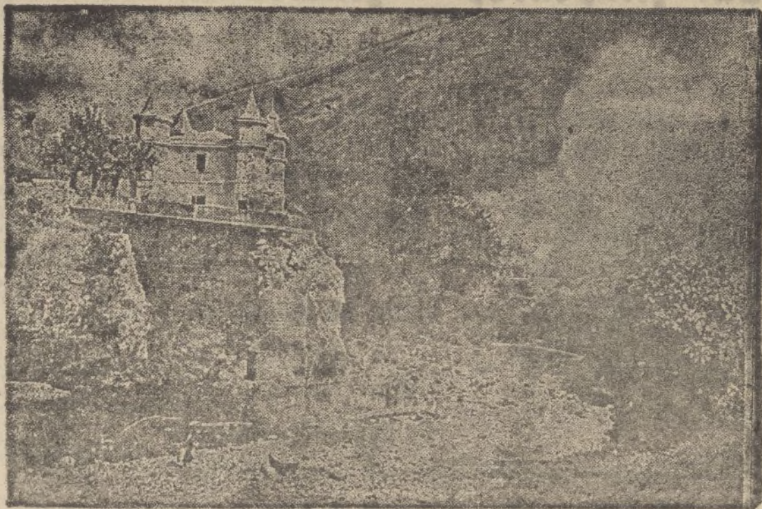
El puente de la bajada a la estación del balneario de las Caldas, volado por los rojos.

que, merced a la generosidad del Generalísimo Franco, han salido del territorio nacional para incorporarse a la zona roja. Entre las personas llegadas a Marsella en el mencionado barco figura la escritora doña Pilar Millán Astray, hermana del general del mismo apellido.