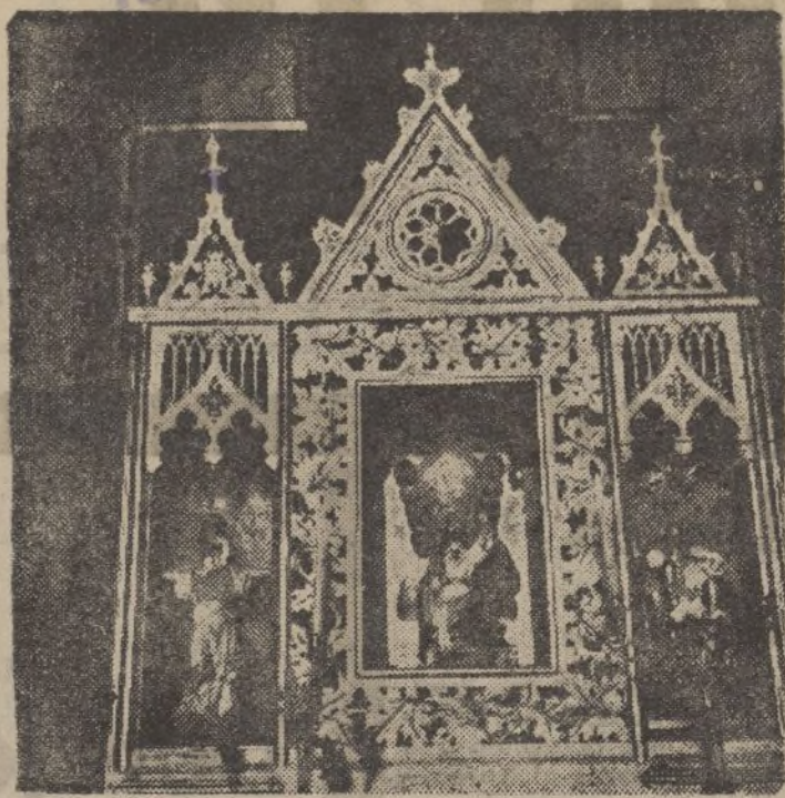
Detalle del altar con la imagen del Sagrado Corazón al centro, a los lados, una Virgen y un Niño Jesús, mutilados por los rojos en Pozuelo.