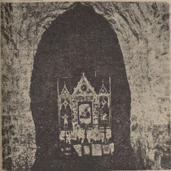
Ermita cavada en la Casa de Campo en la posición que ocupaba la 2.ª Bandera de Falange de Tenerife.

Mil gracias a los dos Pepes—perdonen la familiaridad— y «Avanti».