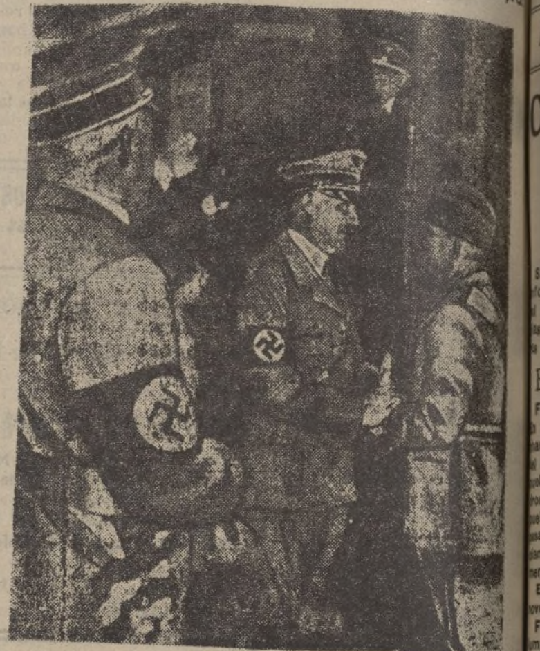
El primer encuentro del Duce con Adolfo Hitler en la estación ferroviaria de Munich

En Salamanca son recibidos con entusiasmo los 114 flechas que regresaron de Alemania