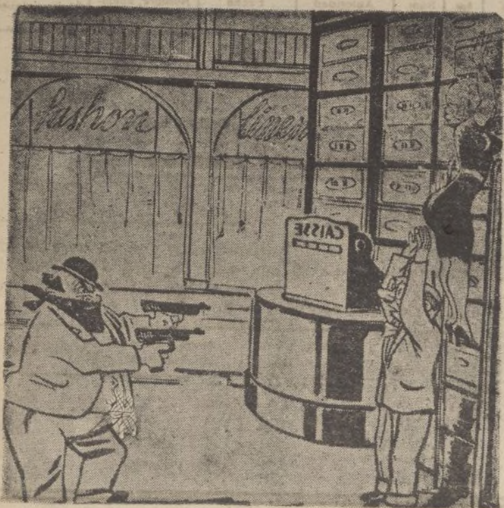
El gangster.—Manos arriba... Pero no demasiado arriba, que es mi novia.