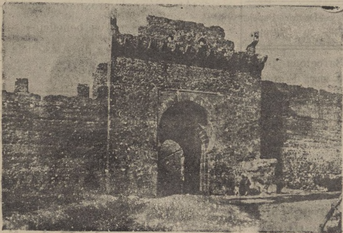
Puerta del Alcázar de Carmona por la cual desfilaron un día las altivas huestes de un rey árabe, destronado por la Fé cristiana y siglos después—22 de Julio de 1936—las del invicto caudillo Franco